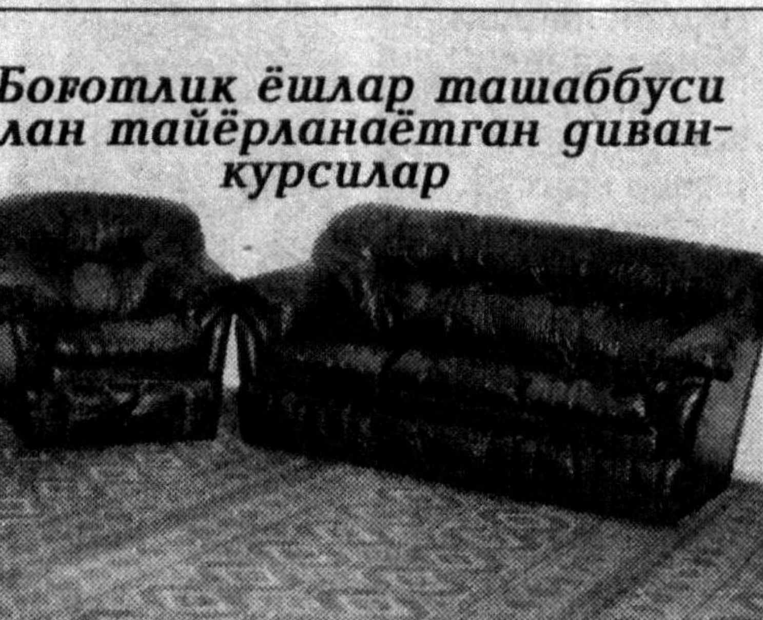
Бовотлик ёшлар ташаббуси билан тайёрланаётган диван-курсилар

интернатда яратилган шaroитлар мисолда ҳам билдириш мумкин. Боиси, ўқувчилар туман ҳокимиятининг ёрдами билан тўғридан-тўғри Республика Тест марказига боргани, ўзларининг билимларини синнашмоқда.