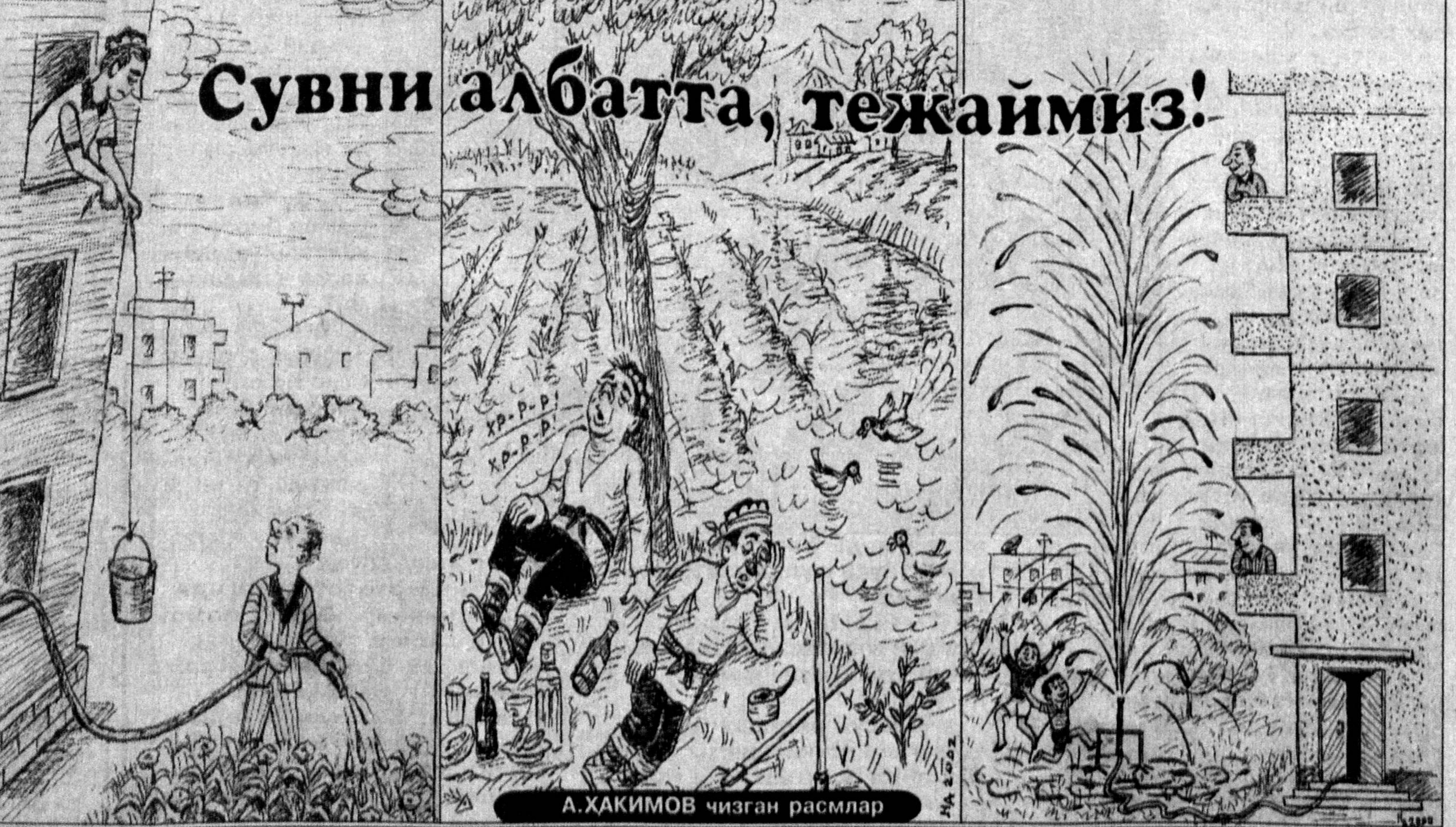
А. ҲАКИМОВ чизган расмлар