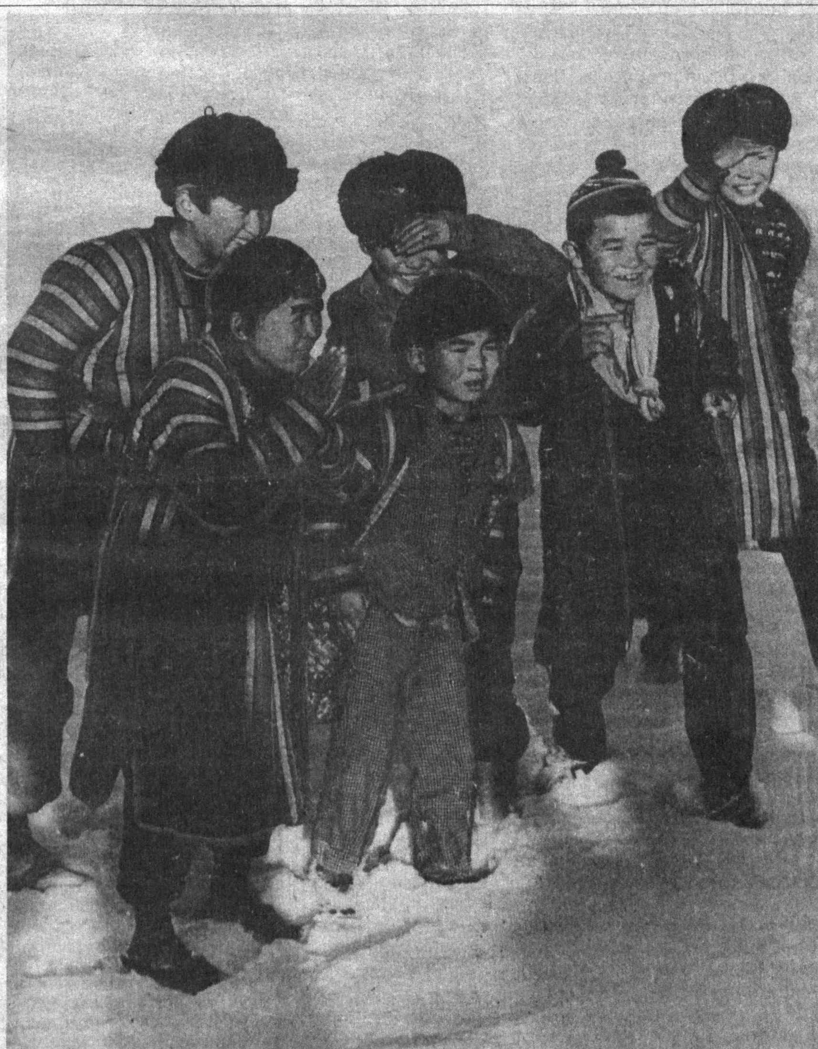
Рамазон айтиб келдик уйингизга