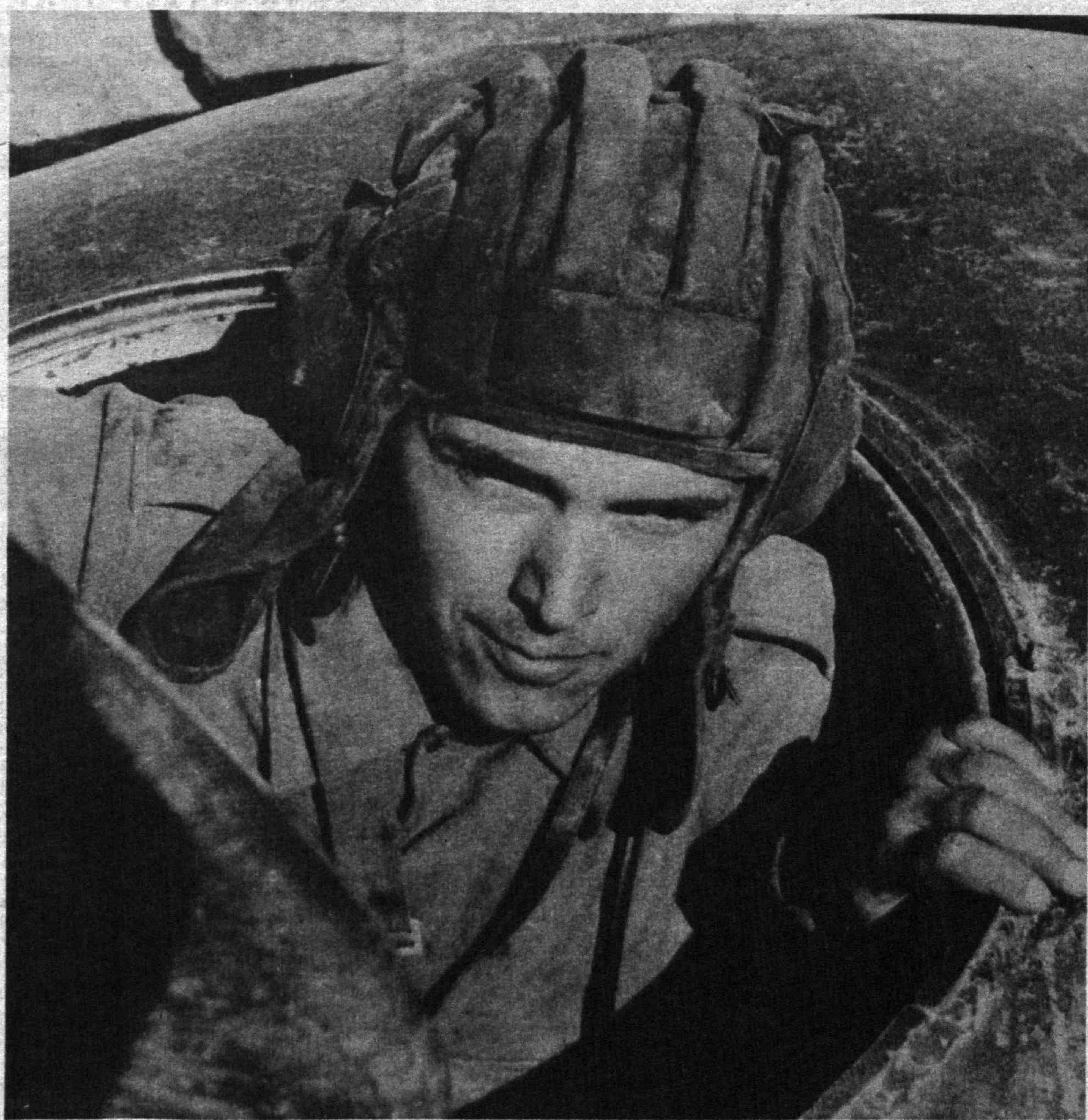
Ватаннинг сергак ўғлонлари омон бўлсин

Ўзбекистонга илк марта ташриф буюрган Геннадий Куликнинг мамлакатимиз маданий ҳаёти билан яқиндан танишиши ҳам режалаштирилган. Жумладан, сафар дастури бўйича шанба кун Россия Федерацияси ҳукумати раиси ўринбосари Тошкент ва Самарқанд шаҳарларининг диққатга сазовор қадамжоларини зиёрат қилишни мўлжалламоқда.