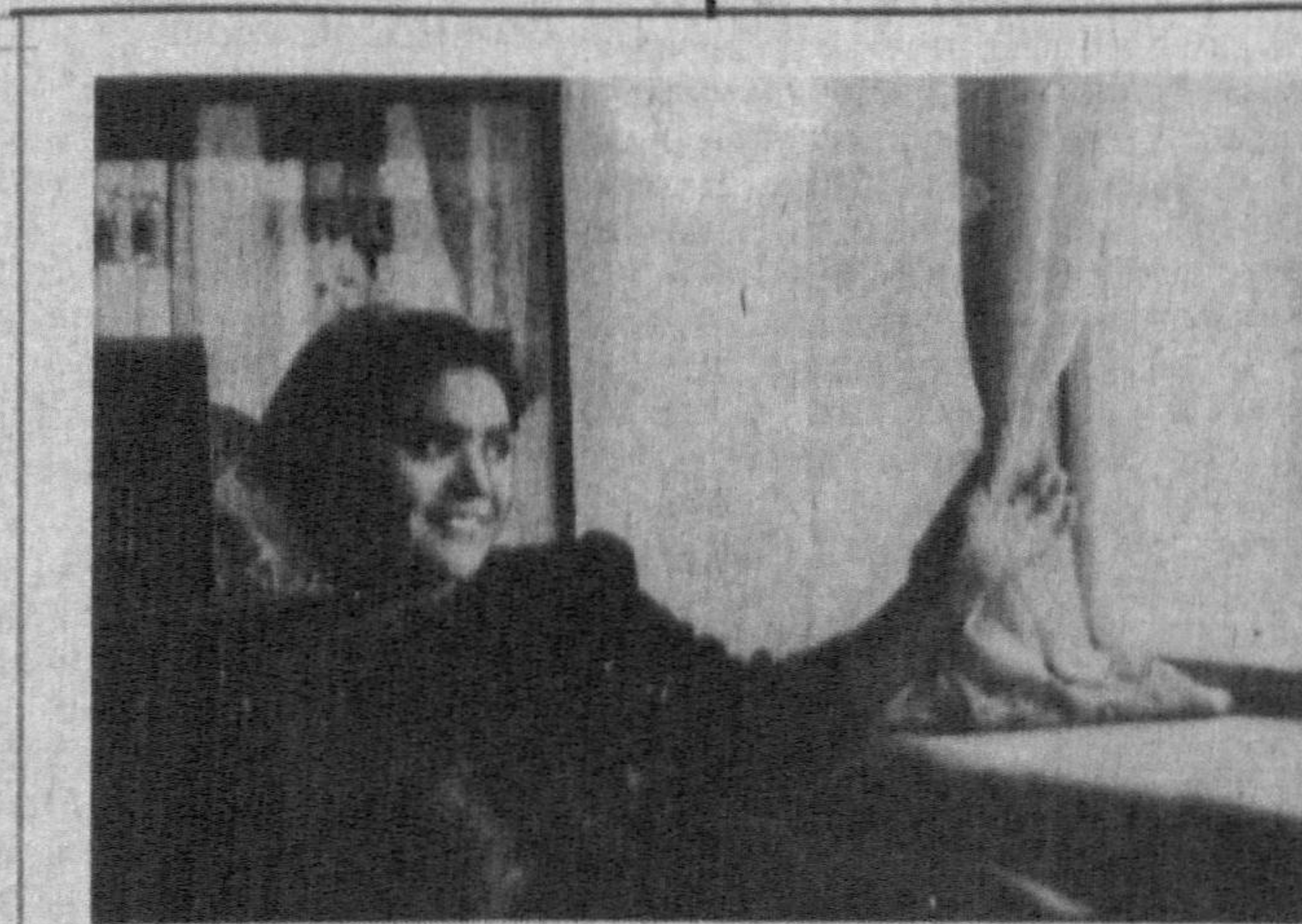
Онанинг кўнгли болада...