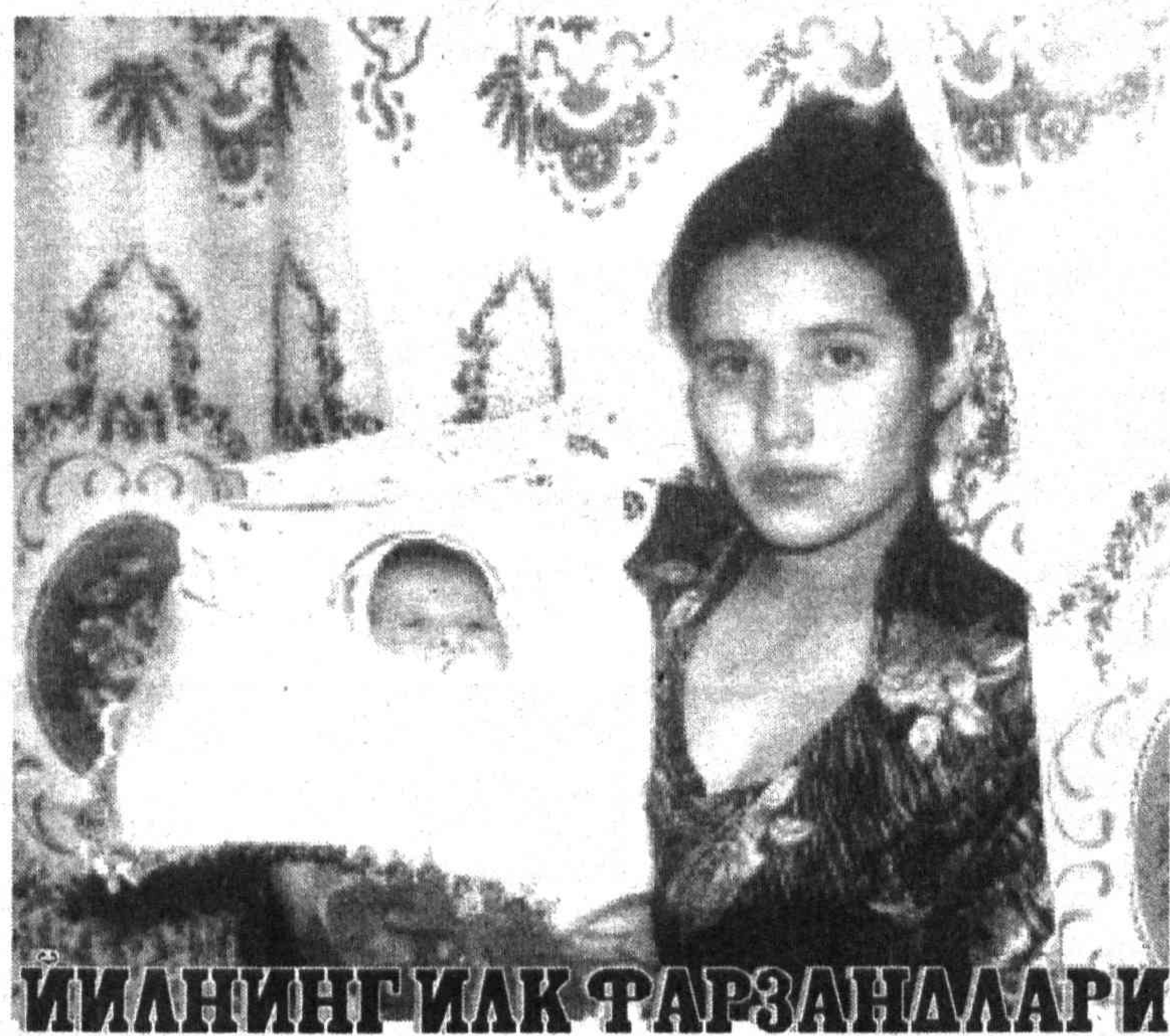
ИЛМИНГ ИЛК ФАРЗАНДАРИ