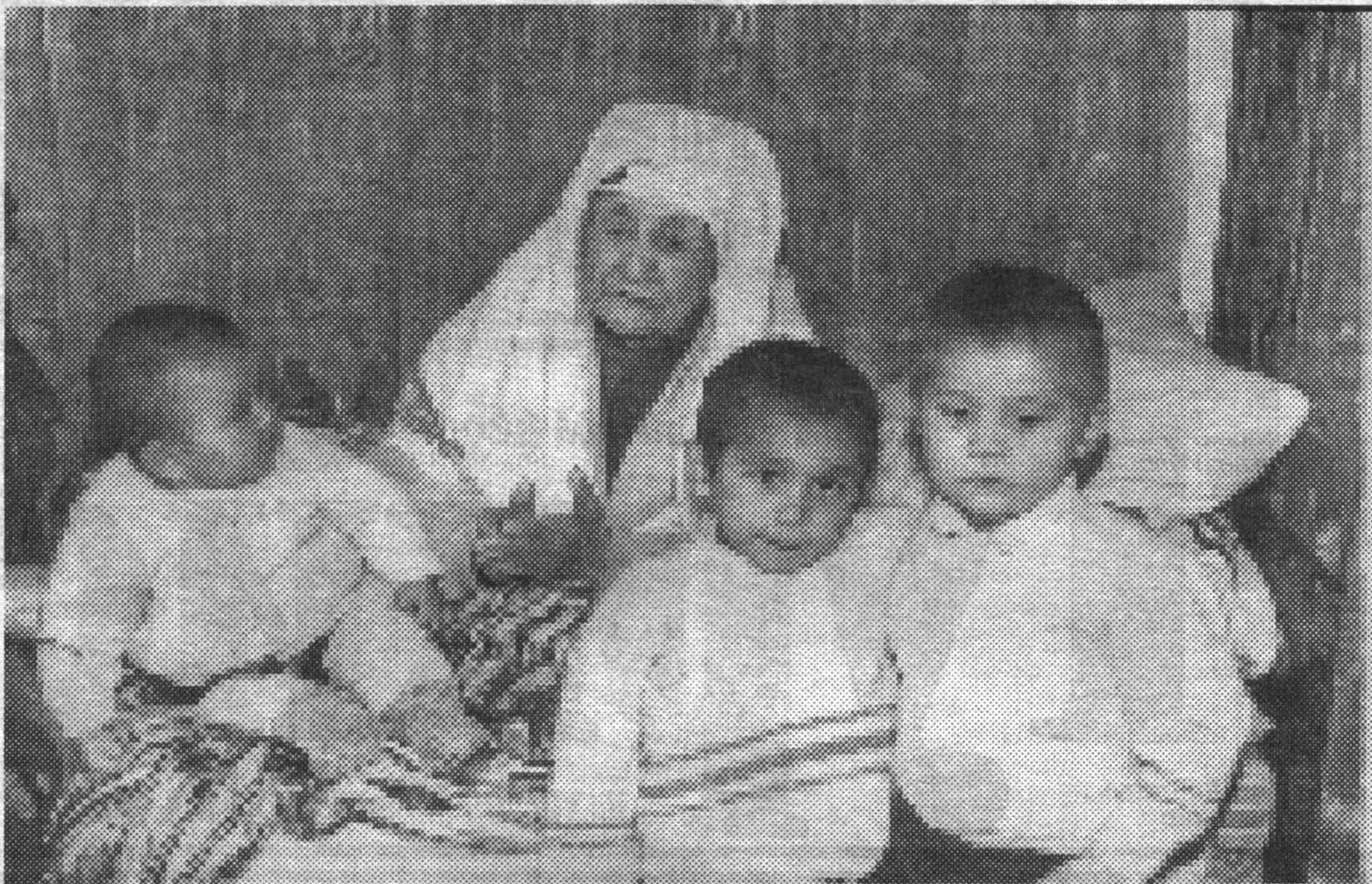
104 ёшли Соҳиба момо: — Илоҳи, фарзандларимиз бахтига Ватанимиз тинч, Юртбошимиз омон бўлсин!