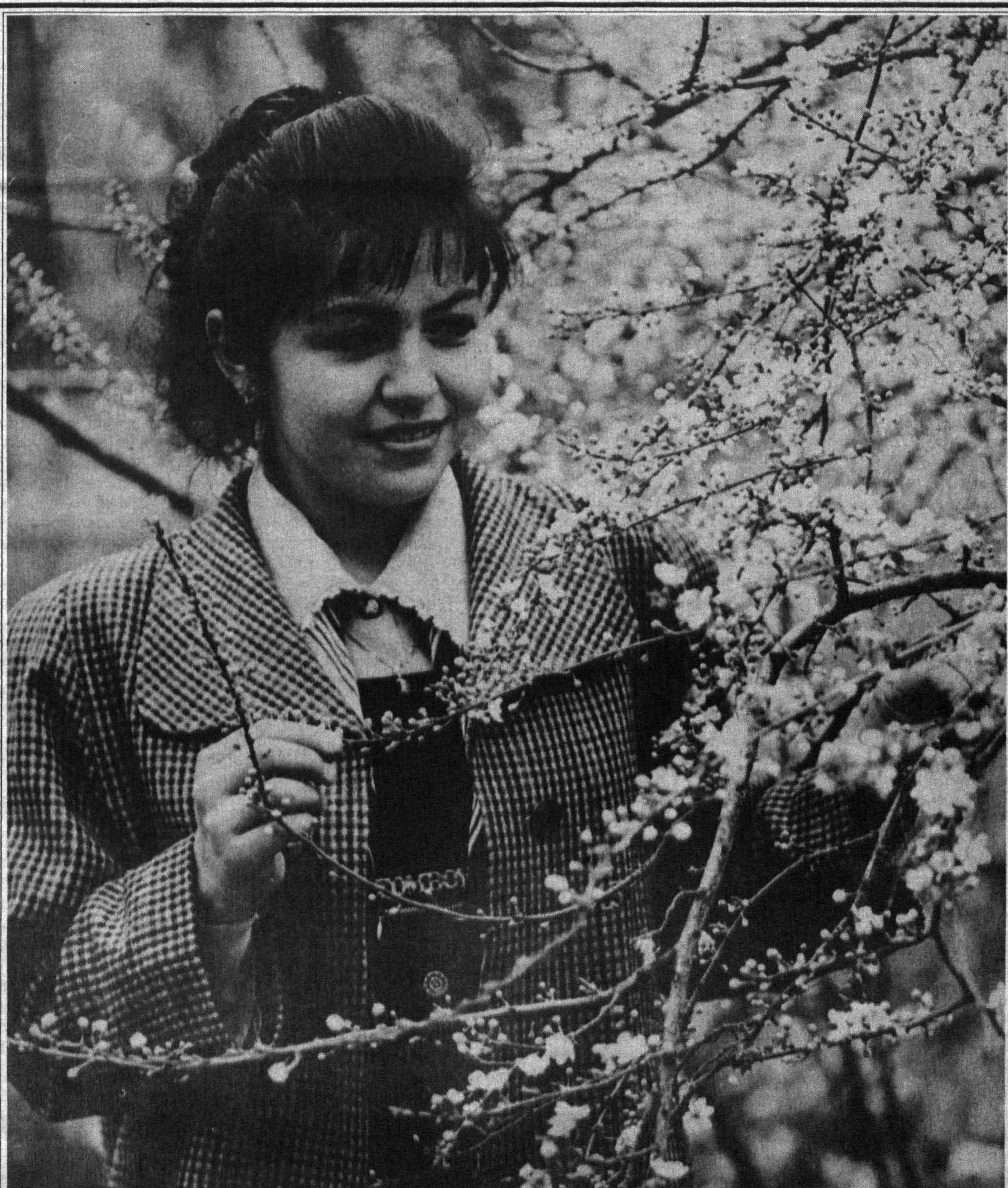
ҚАЛБИНГИЗГА БАҲОР БИЛАН КИРСИН УМИДЛАР...

Капитал маблағларни ўзлаштириш режага нисбатан икки марта ортди. Ишлаб чиқариш қудратини кенгайтириш соҳасида кўплаб ижтимоий, маданий объектлар, иншоотлар фойдаланишга топширилди. Лекин вилоятни иқтисодий-ижтимоий ривожлантиришни таъминлаш бора-бора муаммолар ҳам йўқ эмас.