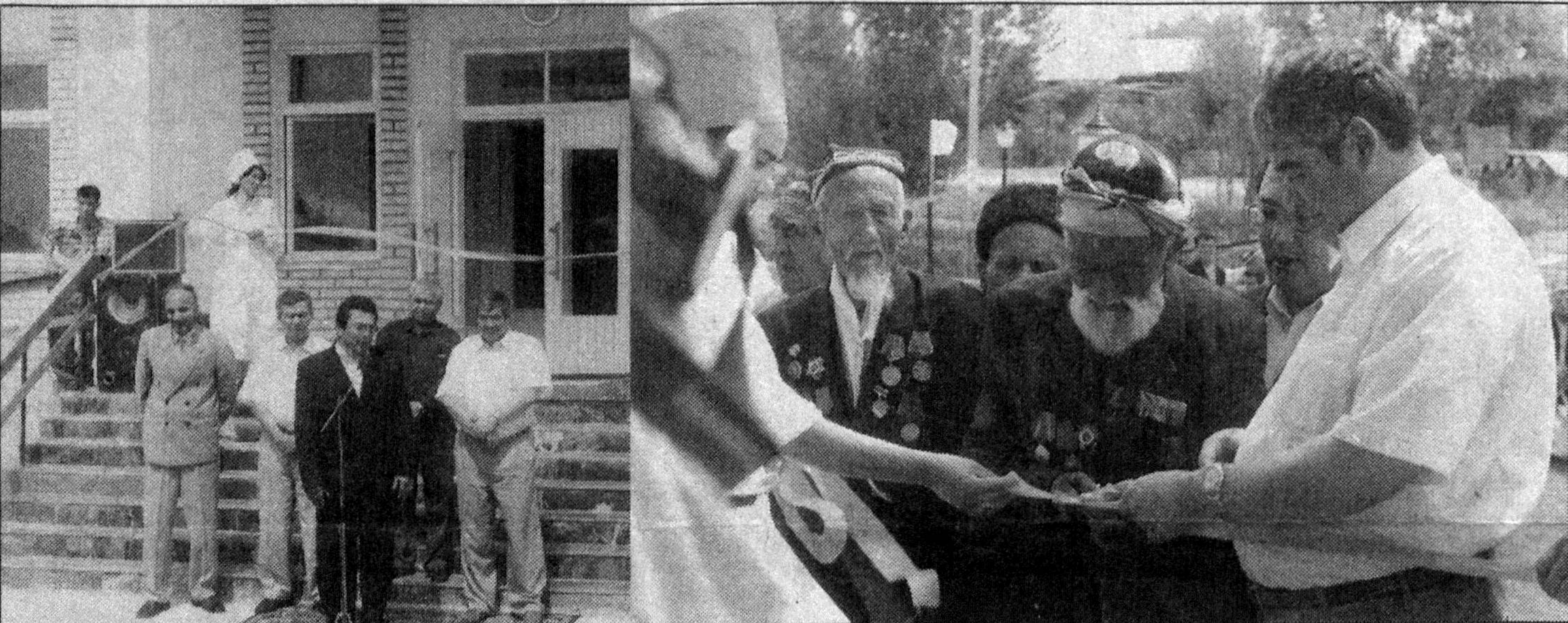
Навоий вилояти Навбахор туманидаги уч қишлоқда тез тиббий ёрдам пункти ишга тушди. Деярли барча қишлоқлар газ ва тоза ичимлик суви билан таъминланди. Суратларда: Навбахор туманида навбатдаги тез тиббий ёрдам пунктининг очилиш маросими-дан лавҳалар

Кўпчилик ота-оналар фарзанд-лари кўнглида илмга ҳавас уйғотиш