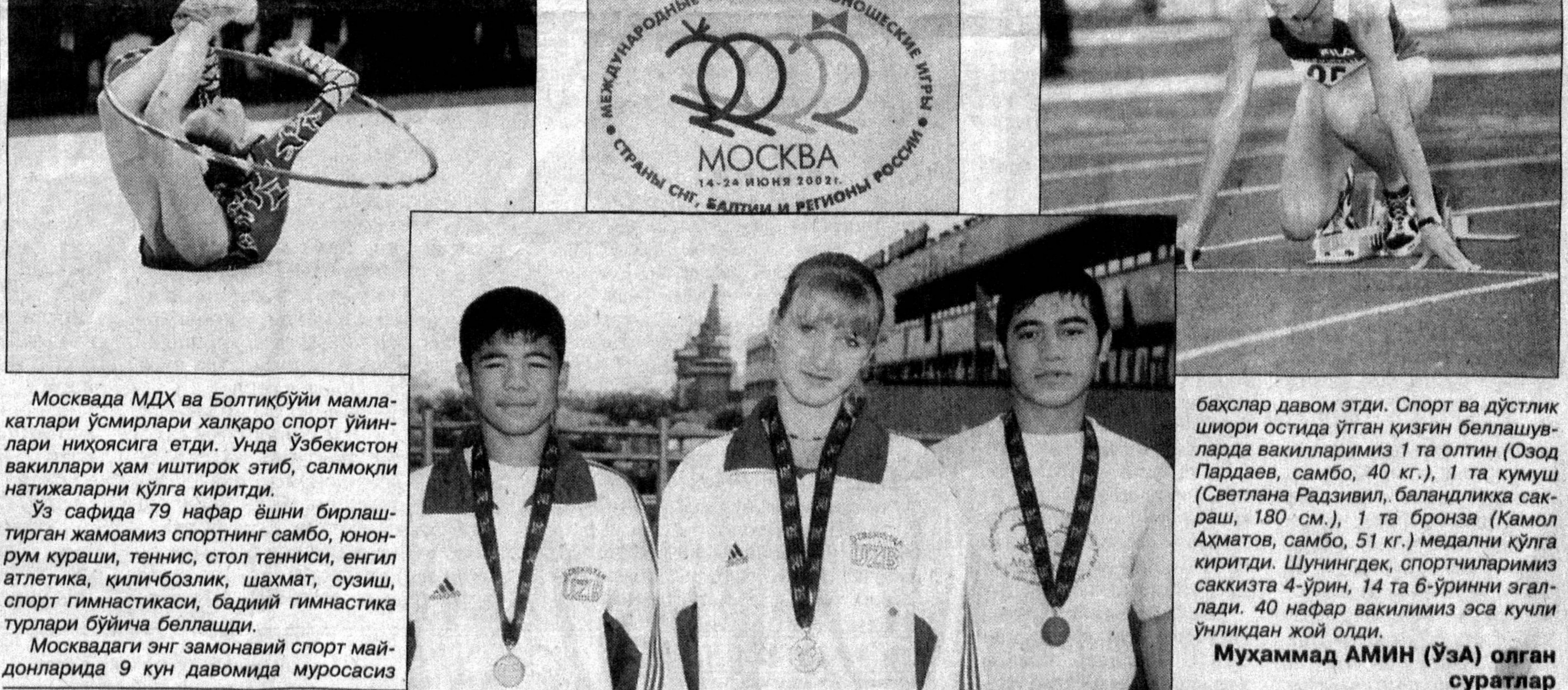
Москвада МДХ ва Болтиқбўйи мамлакатлари ўсмирлари халқаро спорт уйинлари ниҳосига етди. Унда Ўзбекистон вакиллари ҳам иштирок этиб, салмоқли натижаларни кўлга киритди.

Уз сафиде 79 нафар ёшни бirlаштирган жамоамиз спортнинг самбо, юнорум кураши, теннис, стол тенниси, өнгил атлетика, қиличбозлик, шахмат, сузиш, спорт гимнастикаси, бадий гимнастика турлари бўйича беллашди. Москвадаги энг замонавий спорт майдонларида 9 кун давомида мурасасиз