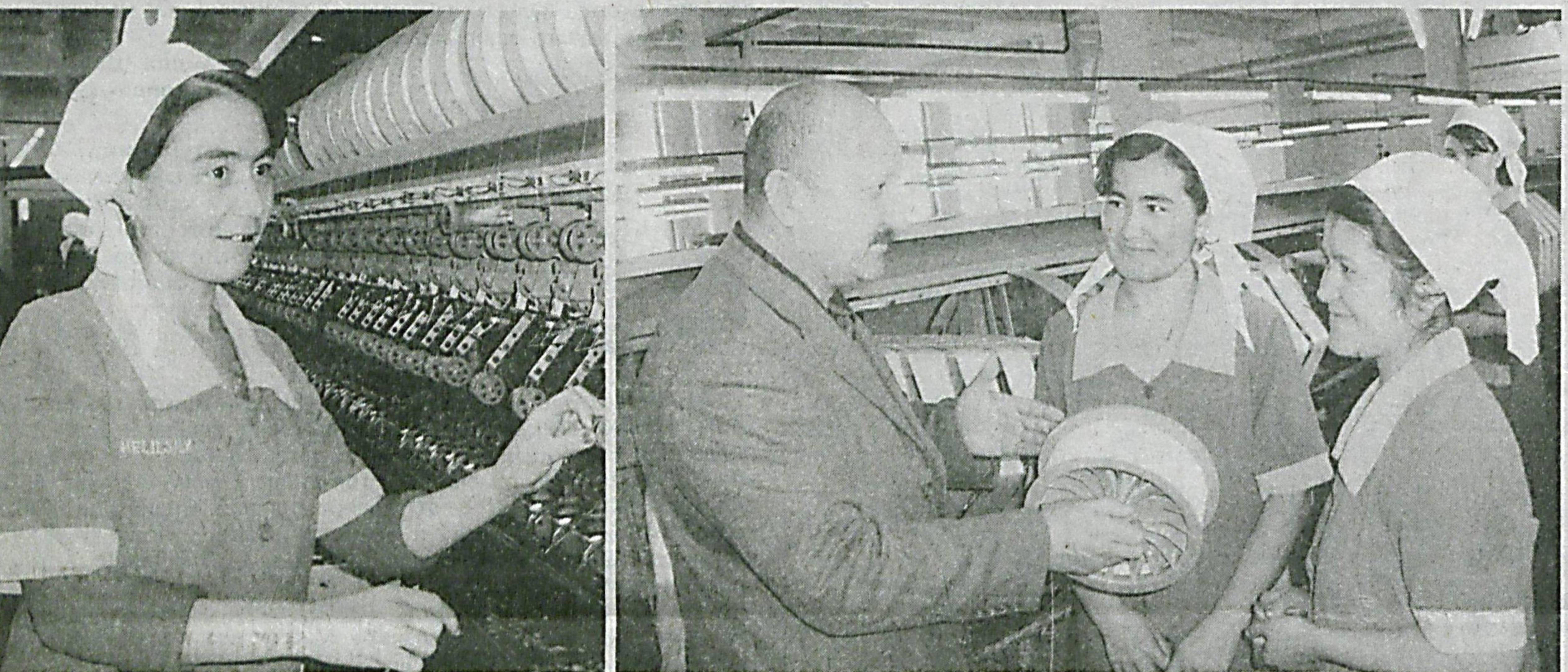
Наманган шаҳридаги «Helisilk» Ўзбекистон-Хитой қўшма корхонасида ишлаб чиқарилаётган маҳсулотлар юқори сифати билан кўпчиликка манзур бўлмоқда. Шунингдек, бу ерда ишчиларга яратилган шароитлар ҳам иш унумига ижобий таъсир этиб, корхона фаолиятида муҳим рол ўйнаётир.