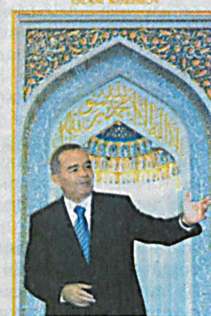
YÜKSƏK MƏNAVİYYAT - YENİLMƏZ GÜC

Маълумки, Президентимиз Ислоҳ Каримовнинг «Юксак маънавият — енгилмас куч» китоби мамлакатимиз ва дунё жамоатчилиги томонидан катта қизиқиш ва эътибор билан қутиб олинди.