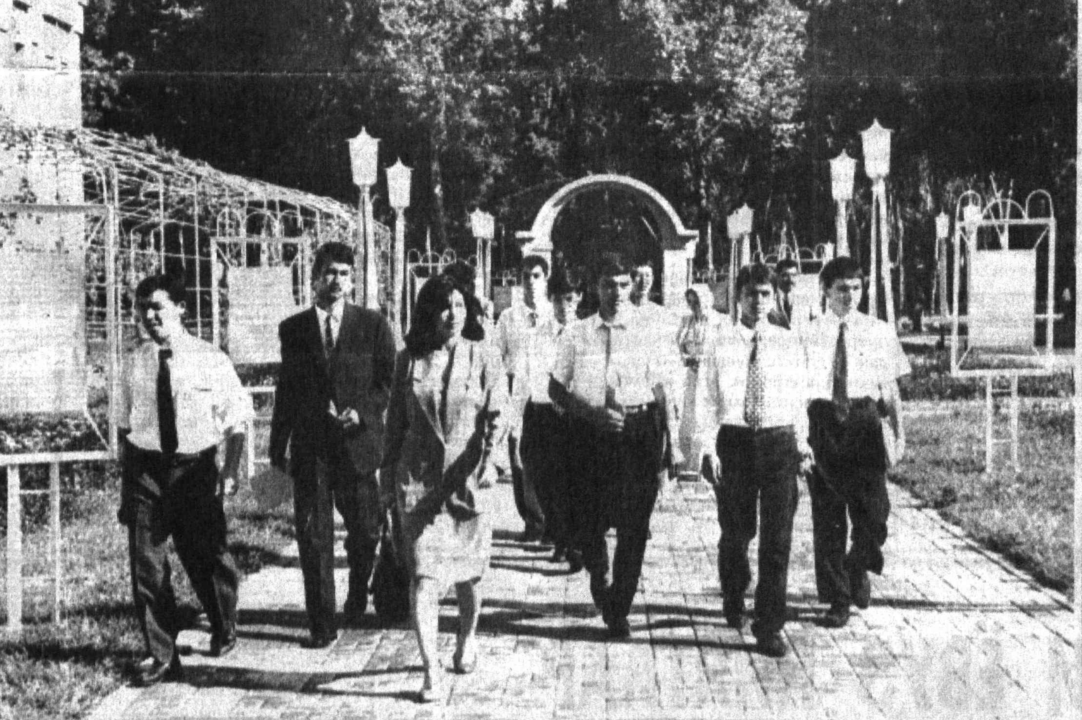
Ушбу билан босаётган қадамларингиз омадли келсин, ўзбекистон авлодлари!

йўл орқали олий таълим муассасаларининг мустақиллигини ошириш, қолаверса олий таълим тизимининг моддий техника базаларини қулайлаштириш. Ҳозир васийлик ва кузатув кенгашларининг лойиҳаси тайёр. Кимдир бир институтга ёрдам бермоқчи, кимдир васийлик қилмоқчи. Бунчи тартибга солиш зарур. Чунки биз ҳуқуқий давлат курашмиз. Ўз-ўзидан жаҳон андозларига мослашиш дари келди. — Таълим кредитлари қилларга берилди? — Истаимизми, йўқми, баъзида иқтидорли талабалар контракт-тўлов асосида ўқишларига тўғри келади. Шундай пайлар ҳам бўладики, моддий ётишмовчилик сабаб талаба ўқишини давом эттиролмайдди. Ана шундайларга имтиёз яратилиш мақсадида 2001-2002 ўқув йилидан бошлаб, талабаларга ўқитишнинг тўлов-контракт шакли учун таълим кредитлари берилди. — Олий ва ўрта махсус таълим вазирлиги абитуриентлар учун қандай қулайликлар яратяпти?