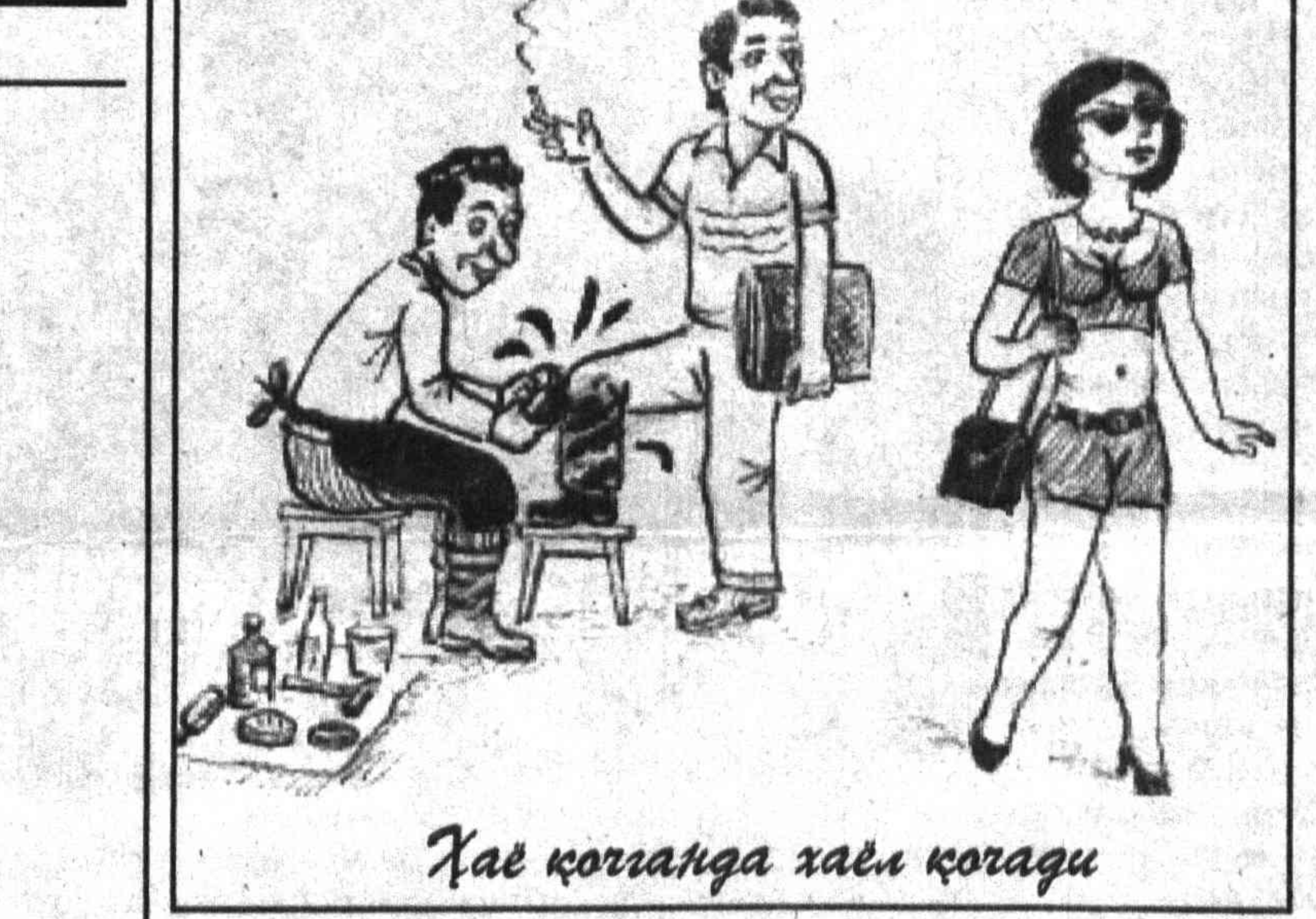
Ҳаё қорангда ҳаёл қоранди