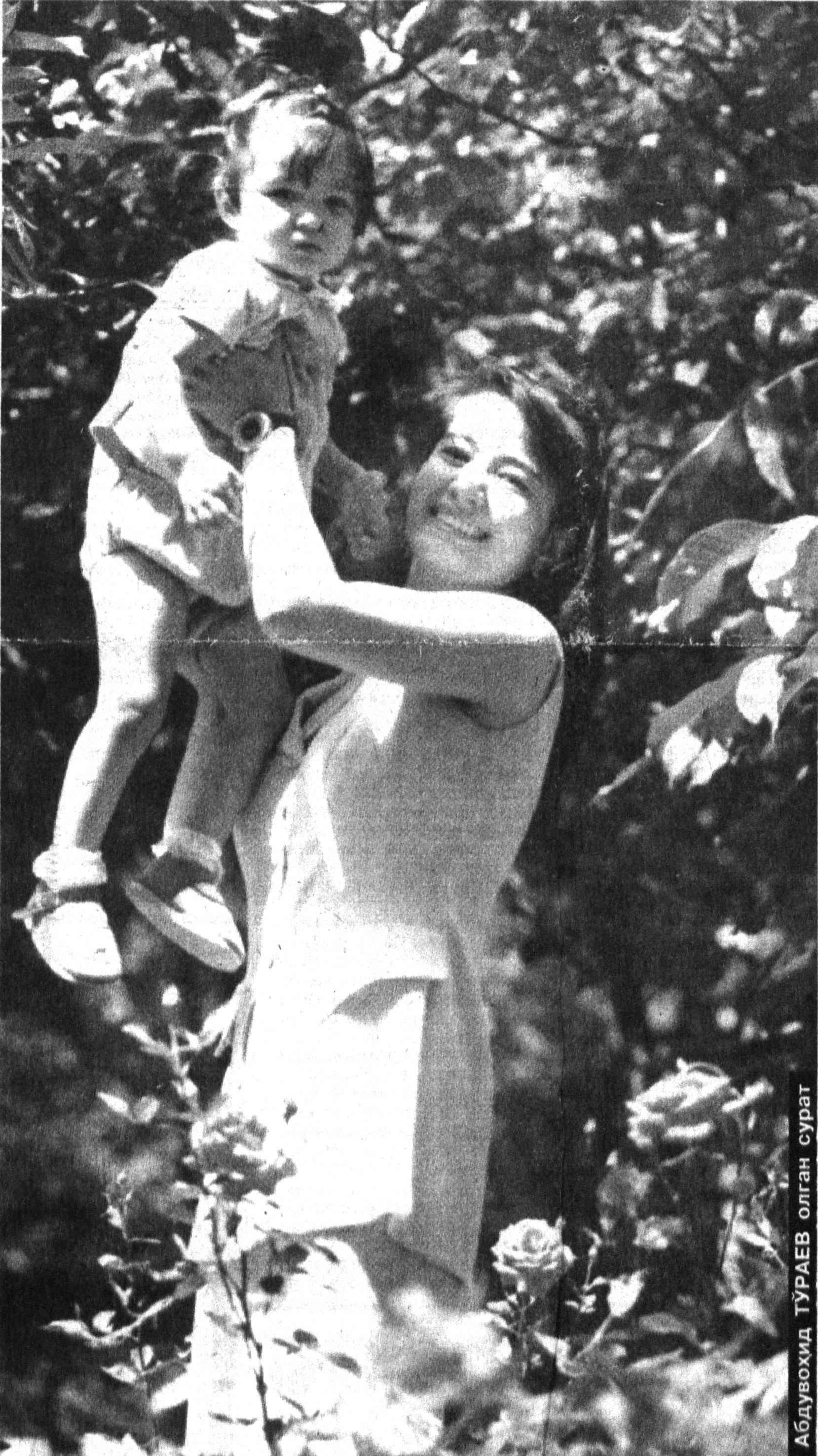
Болалар тушларга, оналар бағри боллага тўқиниб!