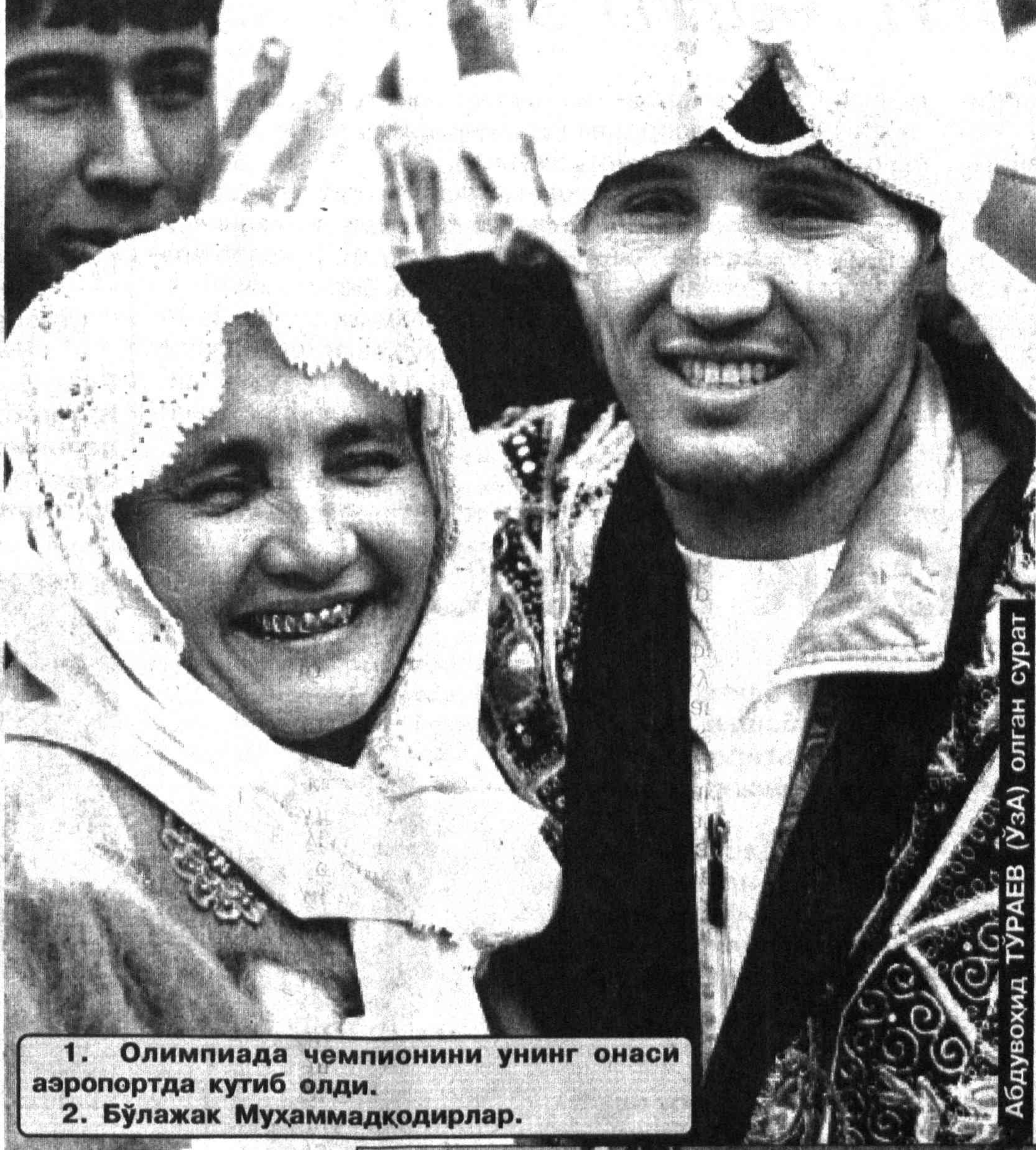
1. Олимпиада чемпиони унинг онаси аэропортда кутиб олди. 2. Бўлажак Мухаммадқодирлар.