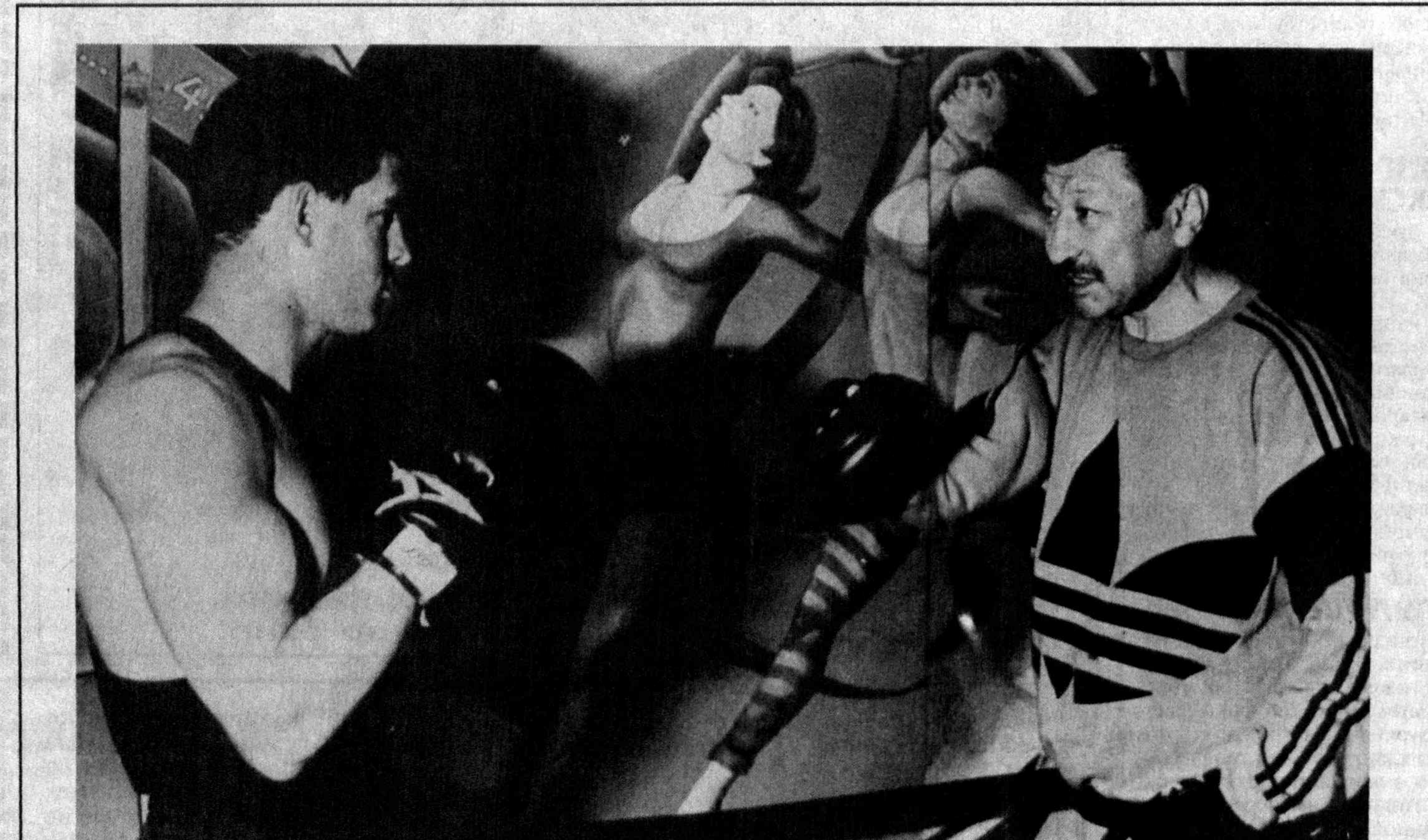
Мамлакат довругини дунёга танитишда спорт ажойиб тарғи-бот воситасидир. Ана шу тарғибот воситасини ҳарқатта келти-рувчи уз қаҳрамонлари бўлади. Бокс бўйича жаҳон чемпионни ва олимпиада уйинлари кўмуш совриндорни, эл уртасида «Олеги йул-барси» деган ном олган Руфат Рискнев ана шундай қаҳрамон-лардан.