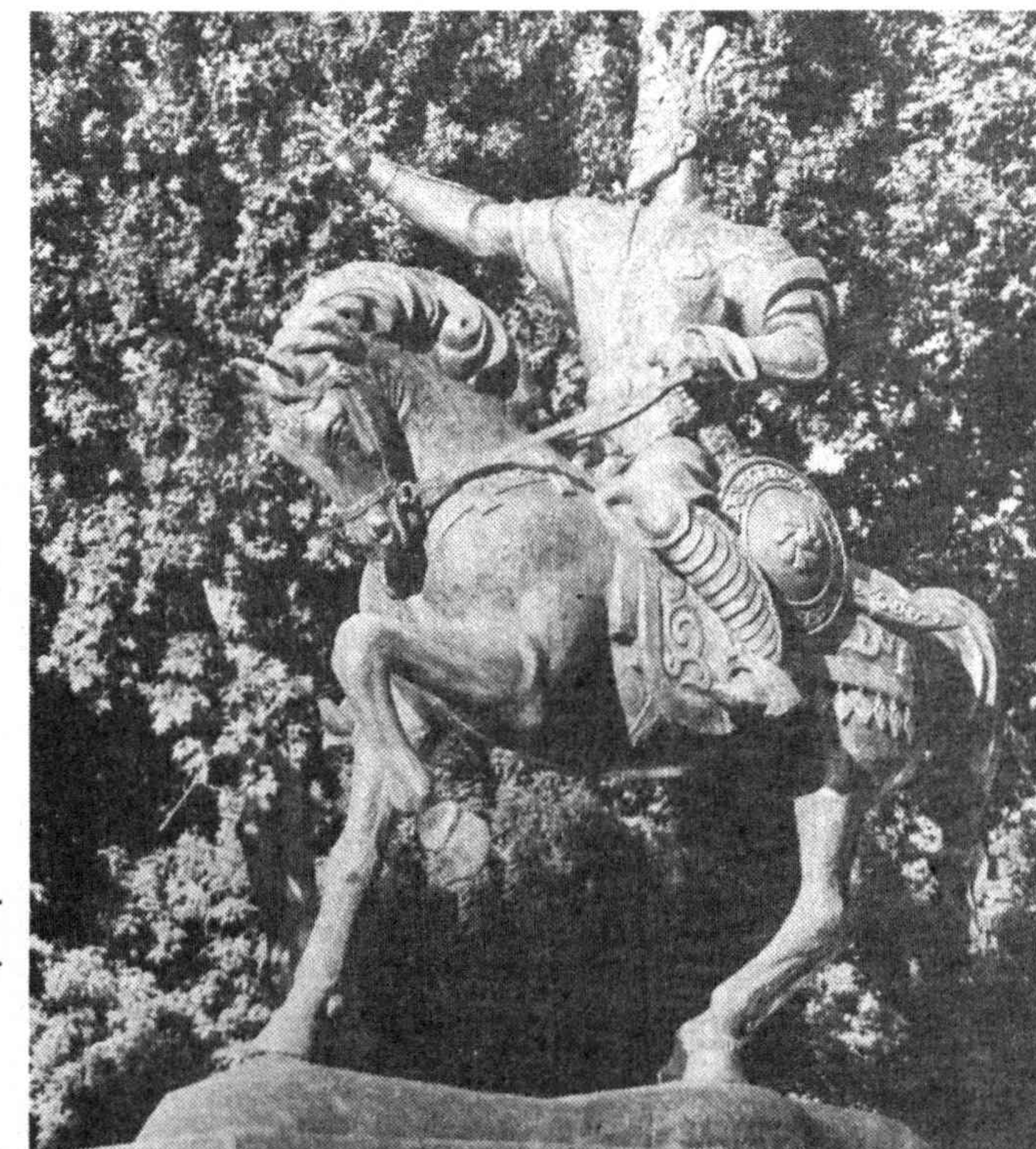
КЕШГА БАҲОР КЕЛДИ (Бадеа)

Мир Кулол номи билан шўҳрат топади. Етти-саккиз ешида Куръони мажидни ед билар, ширали овози билан ҳофизлардек ўқирди. Манъоларини ҳам тушунди, тафсири қила бошлайди. Дин уламолари Амир Кулолга эҳтиром билан қараб, унинг зияратига келиб турдилар. Сўхбатидан олам-олам баҳрам олиб, кунгиллари еришади. Ун беш, ун олти ешларида бозор майдонларида, одамлар гавжум боғларда кураш тушиб, қийқачсини ерга ейиб қўяди. Курашга ким қилиб чиқса, одамлар ҳар ким борича мис ва қумуш тангалар халй қилдилар. Мир Кулол бу тангаларни кам-бағалларга, етим-есирларга бўлиб беради. Илҳом келганида шеър айтиб, қийлаб юради. Баъзи уламолар Мир Кулолнинг бу ишига таажжубланиб: — Шундай азиз одам узини хор қилиши яхшимми? — деб маломат қилдилар. Сурасалар, йигитча: — Мен бу ишни яхши ном чиқариш, шон-шўҳрат қозониш учун қилмайтман. Кураш тушаётганда менда шундай бир қувват пайдо бўлади, бу қувватим Ҳақ даргоҳида қабулмикин, деб курашиб кураман, — деб, бу шеърни уқийди: Кимсани обрўю ном олмаққа жидду жаҳд этар, Сеи они ошақ дема, дунёпараст, бабахт эрур. Бир кунни одалдиқ, Сайид Мир Кулол бозор майдонига кураш тушаётган эди, баъзи савдогар, олим ва мударрислар ул зоти шарифни яна таъна, маломат қила бошлайдилар. — Қаранг, шундай обрўли одам билгит ишлар билан шугулланиб юрибти! Бир замон ана шундай уйла-