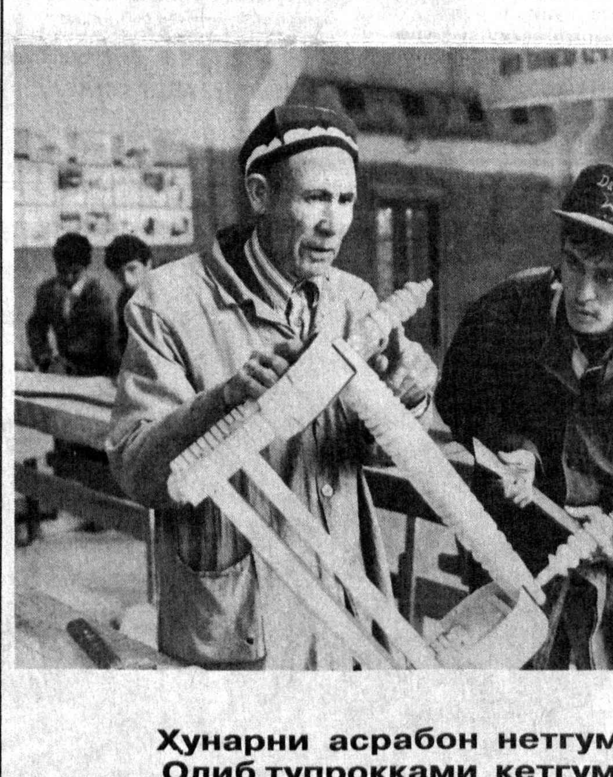
Хунарни асрабон нетгумдир охир, Олиб тупроққами кетгумдир охир.