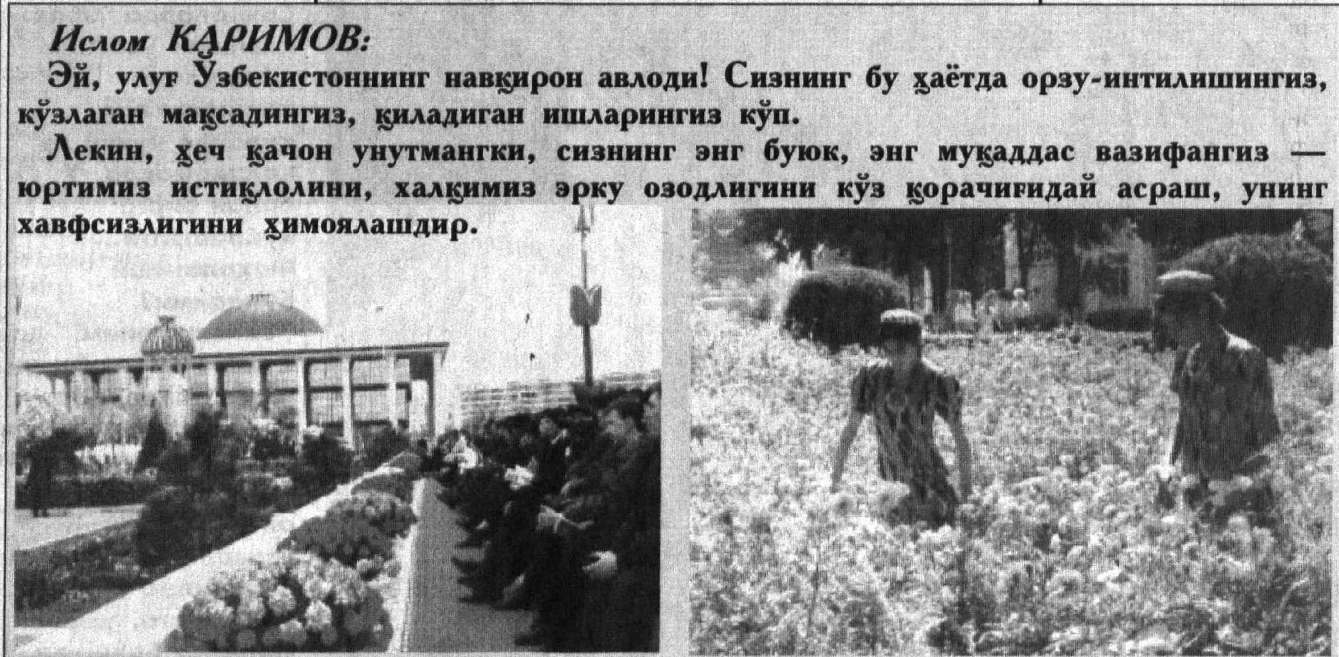
Ислом ҚАРИМОВ: Эй, улуг Ўзбекистоннинг навқирон авлоди! Сизнинг бу ҳаётда орзу-интилишингиз, кўзлаган мақсадингиз, қиладиган ишларингиз кўп. Лекин, ҳеч қачон унутмангки, сизнинг энг буюк, энг муқаддас вазифангиз — юртимиз истиқолини, халқимиз эрқу озодлигини кўз қорачиқдай асраш, унинг хавфсизлигини ҳимоялашдир.

суа сўроқларига жавоб бераётганлар эса нимадан вилоятда норасмий бўлиши мумкин? Ўзбекистон билан мақсадга етмоқчи бўлганларнинг барча-барчасининг номи тарихда қора бўлиб, ланатларга сазовор бўлиб қолган-ку. Мустақил аунёқараш, оқни оқ, қорани қорага ажрата олиш салоҳияти йўқлиги, шундай қобилият шаклланмаганилиги боис мўрт ёшлар нияти ёвуз кимсалар қўлида қўрғоққоққа айланади қолган.