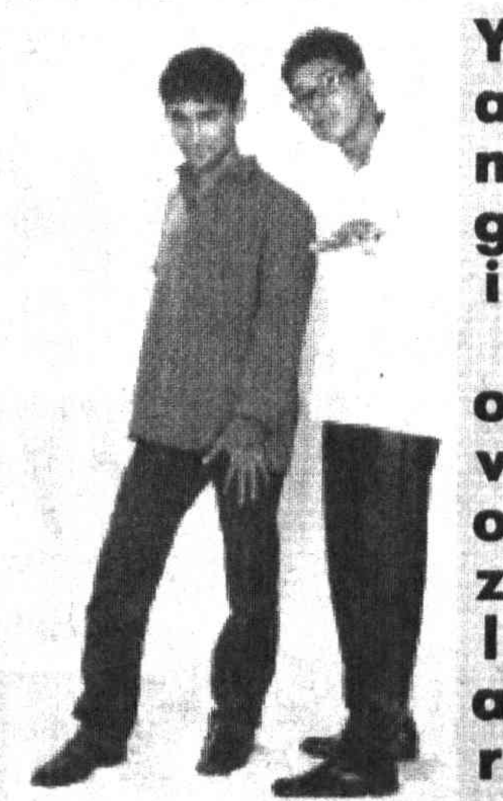
сизми?", "Ўзга бир ишқ", "Ёлғизликда" кўшиқлари ёшлар қалбидан ўрин олган.