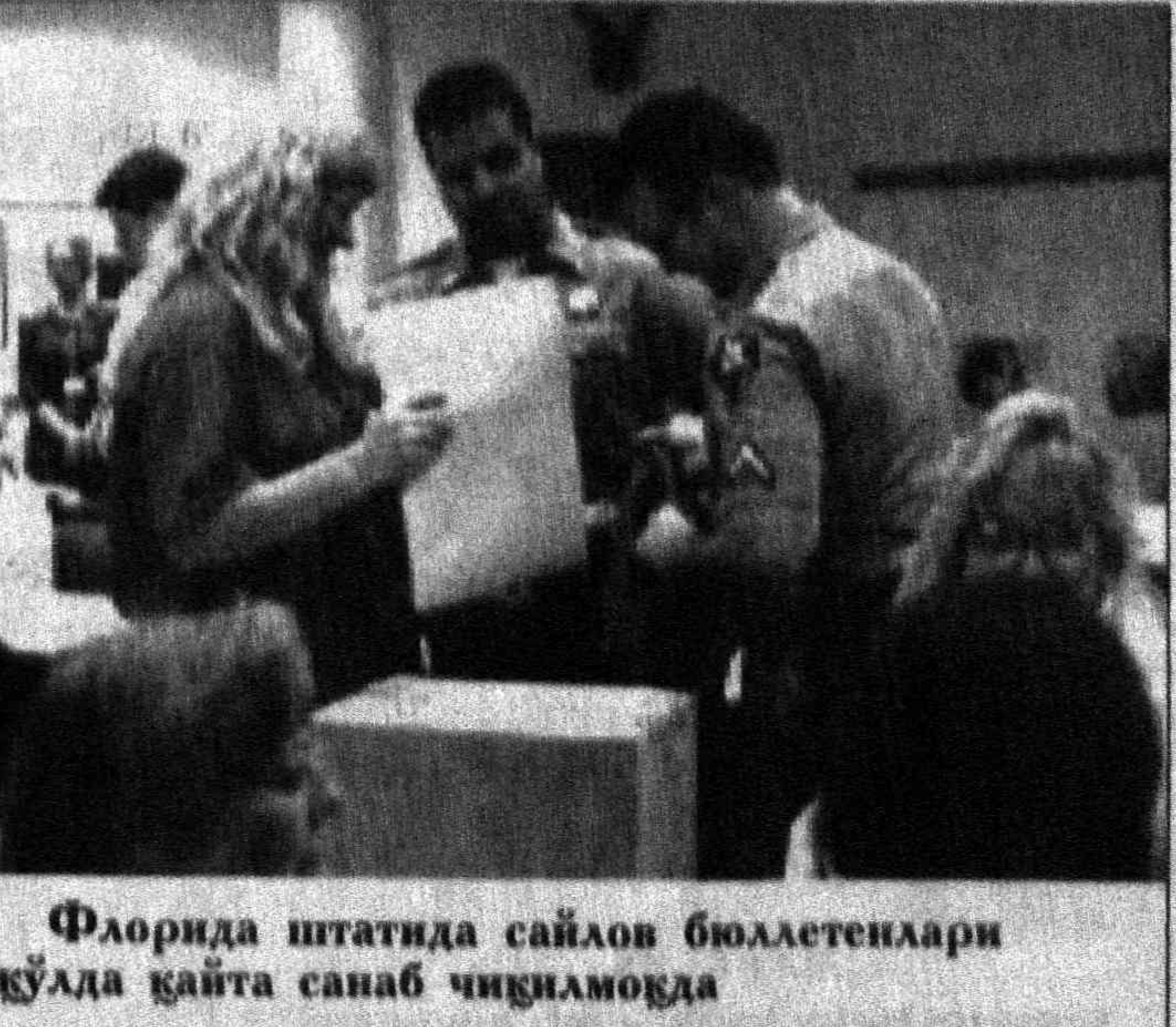
Флорида штатида сайлов бюллетенлари қўлда қайта санаб чиқилмоқда