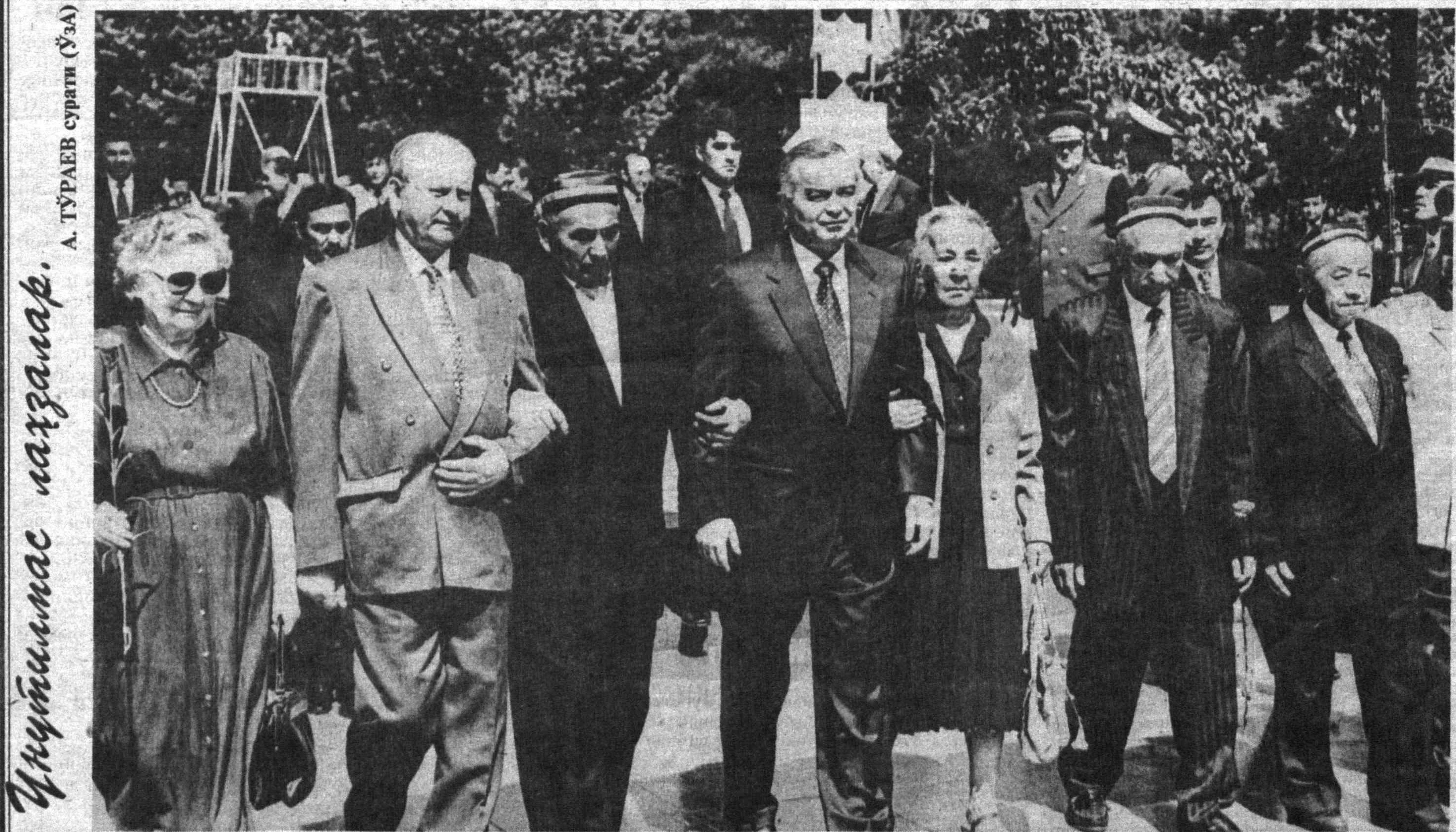
Душанна мас ларзалар.