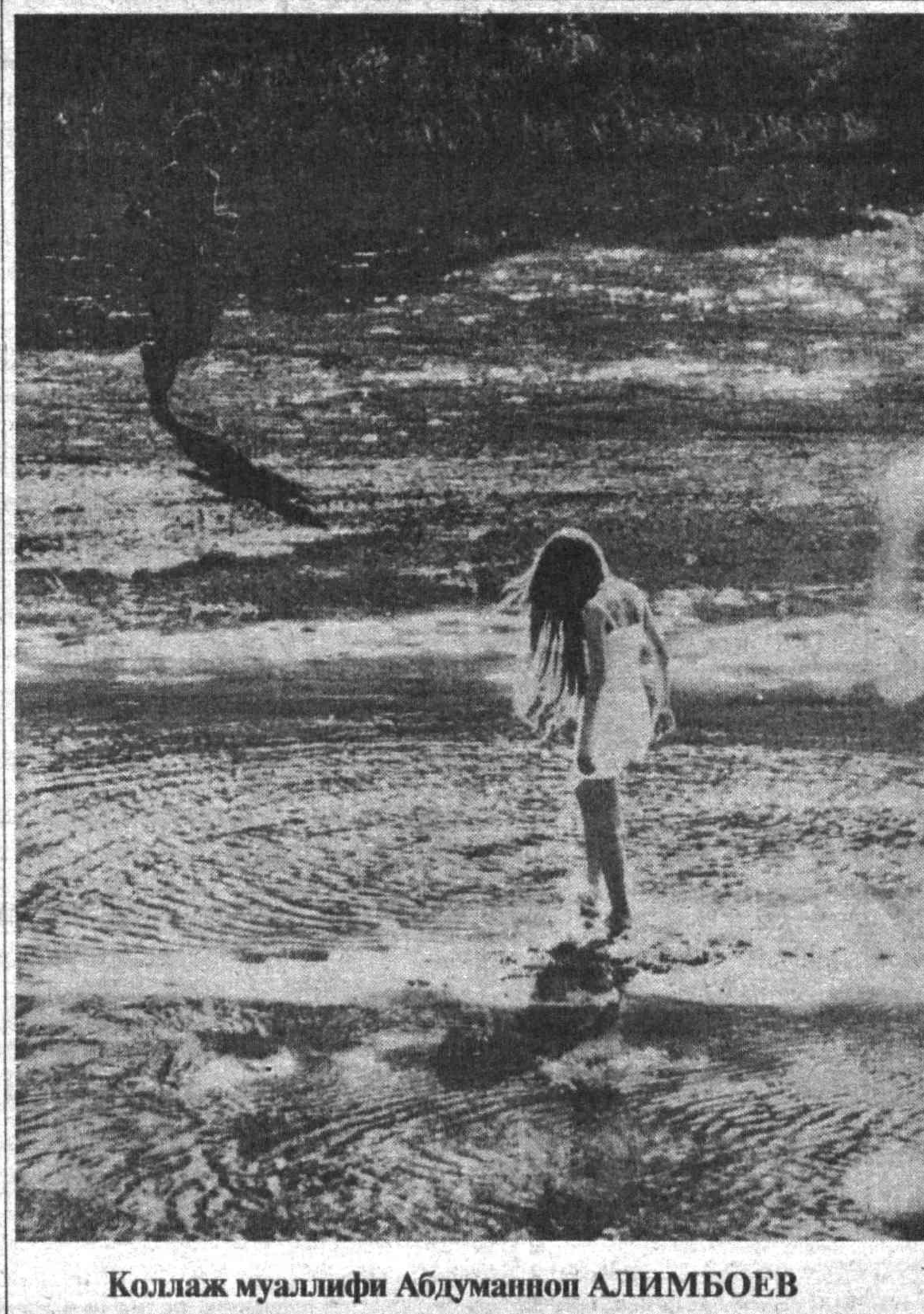
Коллаж муаллифи Абдуманнон АЛИМБОЕВ