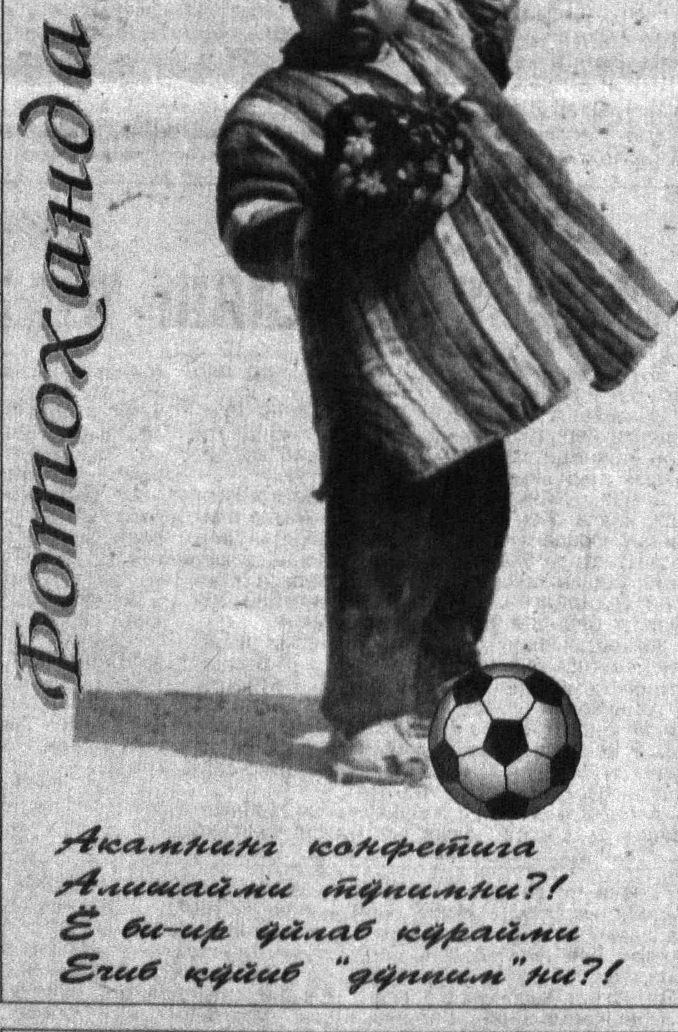
Ақалнинг қонқорига Алишайми қўнғимни?! Ё би-ур қалб қўрайми Еғиб қўйиб "қўнғим"ни?!