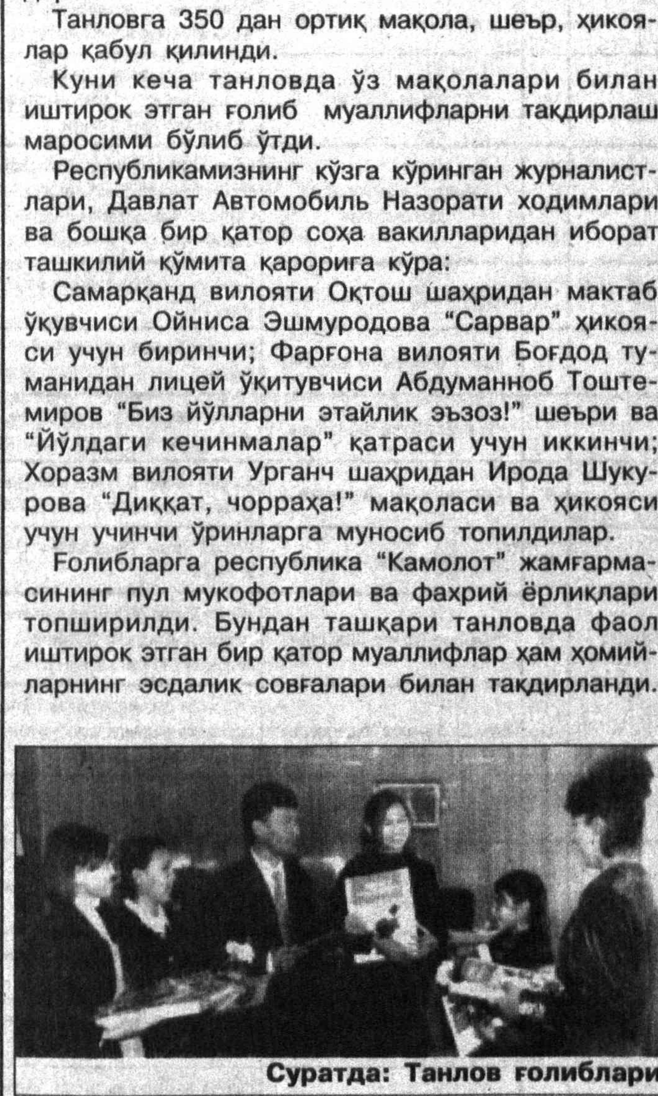
Суратда: Танлов голиблари

Тошкент вилояти Давлат педагогика институтинида факультетлари «Қувноқлар ва зукколар» кўрик-танлови бўлиб ўтди. Танлов якунига кўра, бошланғич таълим методика факультети голиб деб топилди ва вилоят финал босқичига йўлангани кўлга киритди. Голиблар шаҳар «Камолот» жамғармаси фахрий ёрликлари ва ҳомийларнинг қimmatбахо совғалари билан тақдирландилар.