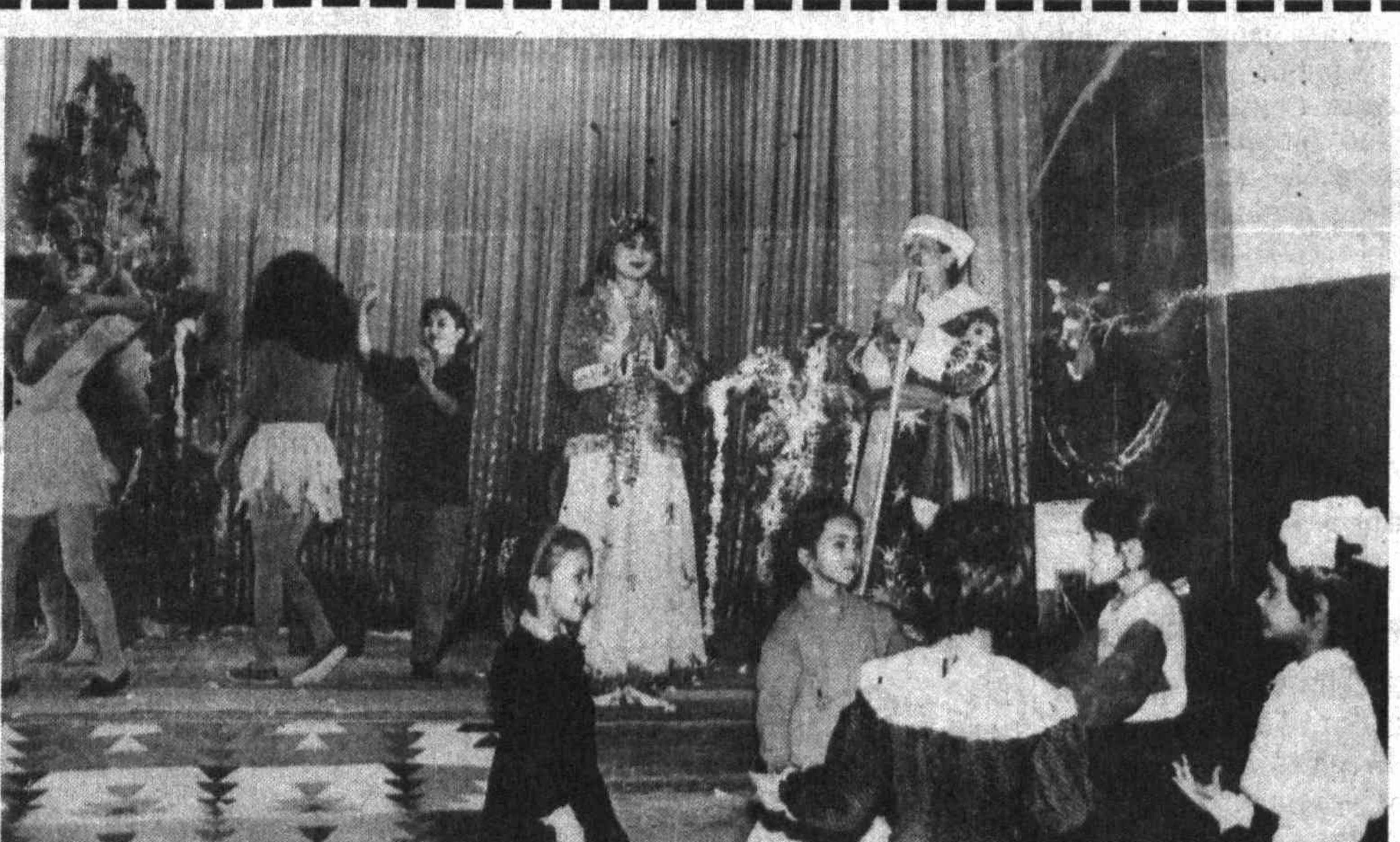
Арча байрам зур бўлди

ЭНГ ЯХШИ ХУМОЯ ХУЖУМКАНИ! Парижда чоп этилган машур «Франс футбол» журнали анангага кура йилнинг энг яхши футболчисини эълон қилди. Олий мукофот «Олтин туш» соврини йигирма йиллик танаффусдан сунг яна ҳимоячига насиб элди. Совриндор эса қарийб чорак асрда булгани каби яна Германия терма жамоаси ҳимоячисидир. Унинг исми Маттиас Заммер. Заммернинг таъкидлашича, у ҳам устози Франк Бекенбауэрға ёпишганидан тақдир қилишни кул кура экан. Ким билади дейсиз, агар ҳаммаси шундай кетаверса, Заммер ҳам вақти келиб у жамоасини жаҳон чемпиони даражасига чиқарар.