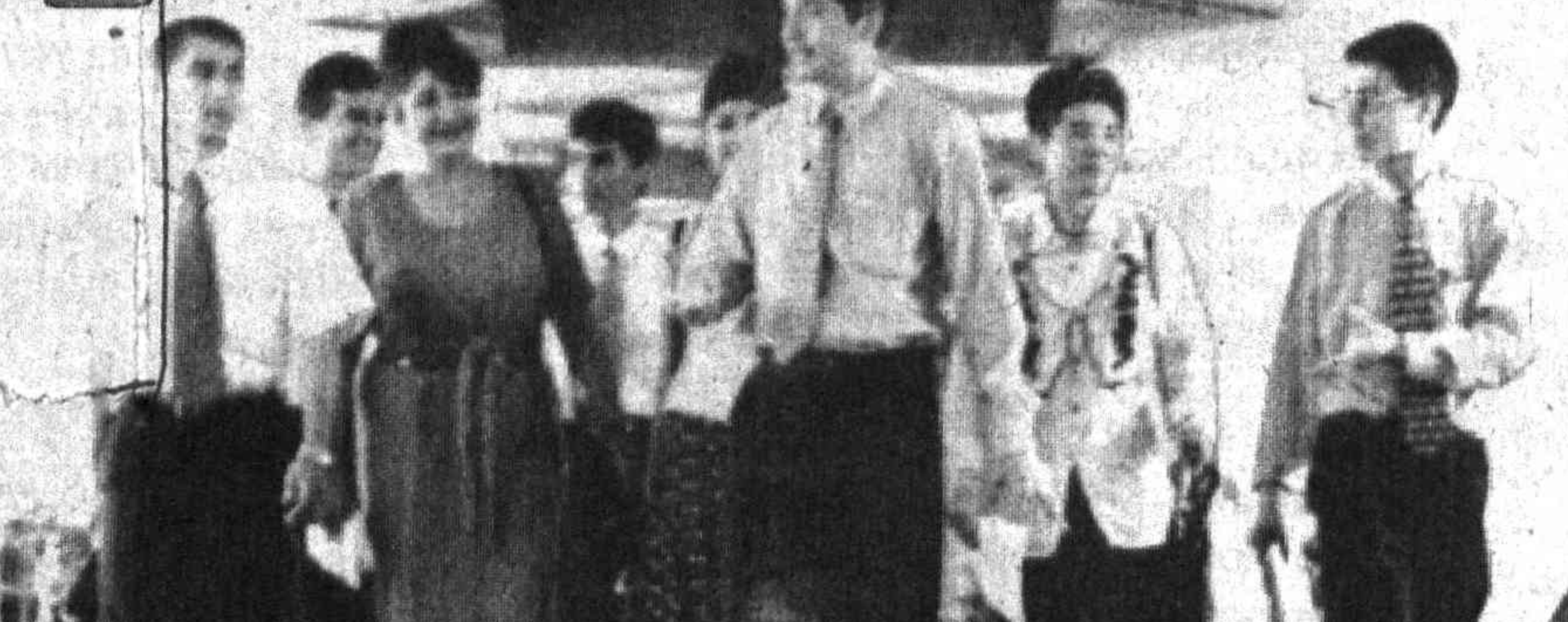
Марғилонда «Ўтораклар клуби» иш бошлади

Борди у фаолиятсизлик қилса-чи? «Ўтораклар клуби» энг шимариб ишга тушган илк кунларданок кўп қаватли битта уйда 23 та бўш хонадон борлиги ва 66 нафар меҳнатга лаёқатли, аммо турли сабабларга кўра бекор юрган фуқаролар аниқланди. Кўққисдан пайдо бўлган аллақандай «Ўтораклар» табиийки, «Сен менга тегма, мен сенга» қабалидаги ҳаёт тарзини мўмай даромад манбаига айлантириб олган айрим кимсаларга ёқмади. Дарҳол иғво ва туҳматдан иборат арзнома битилиб, боши оққан томонга «юмалатиб» юборилди.