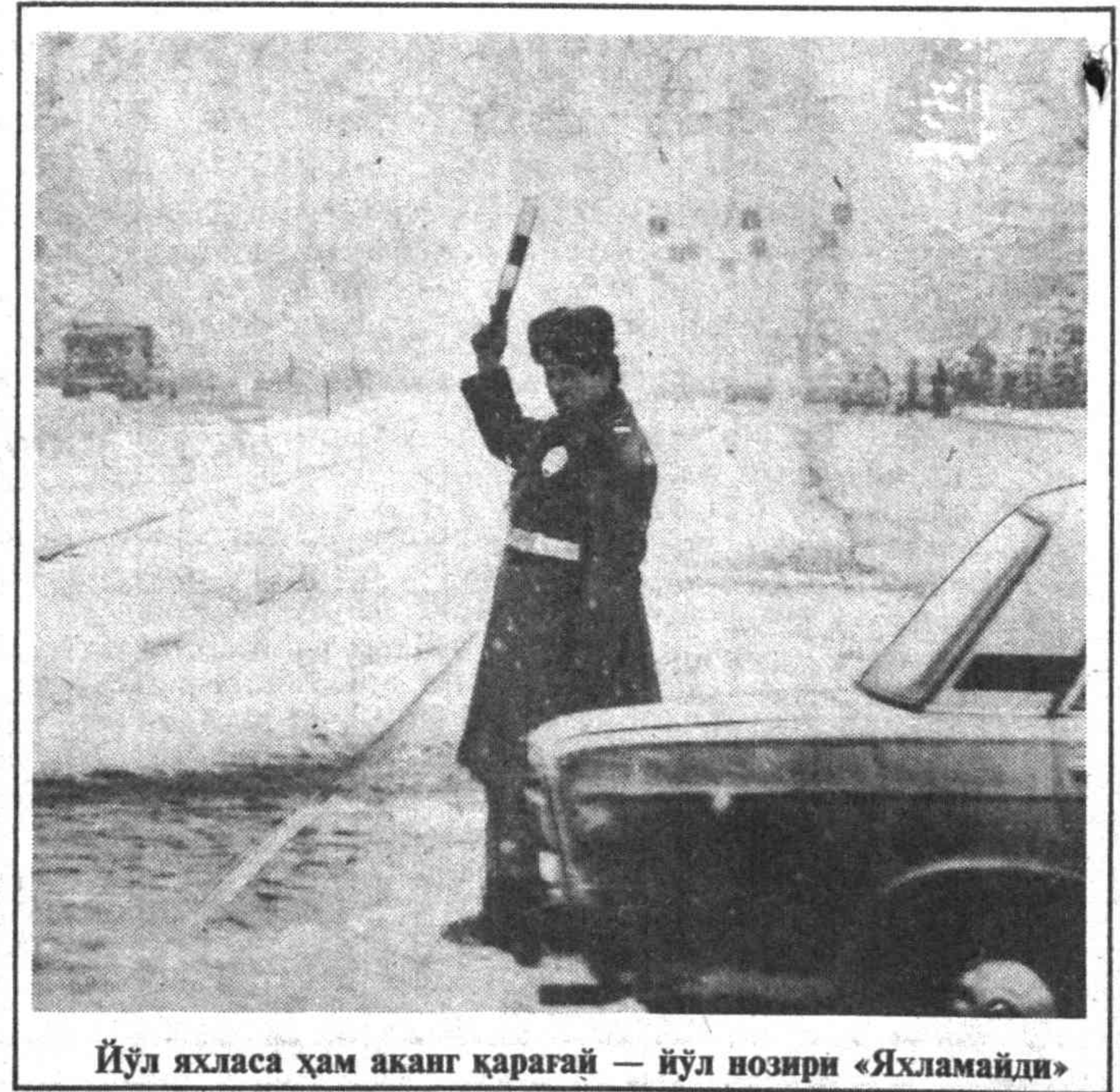
Йул хласа ҳам акаг қарагай — йул нозир «Яхламайди»

Тақдирни қаранг-ки, дус-тим ҳам менинг аҳолимга тушган. Унингдан уйдан ҳаловат кетган.