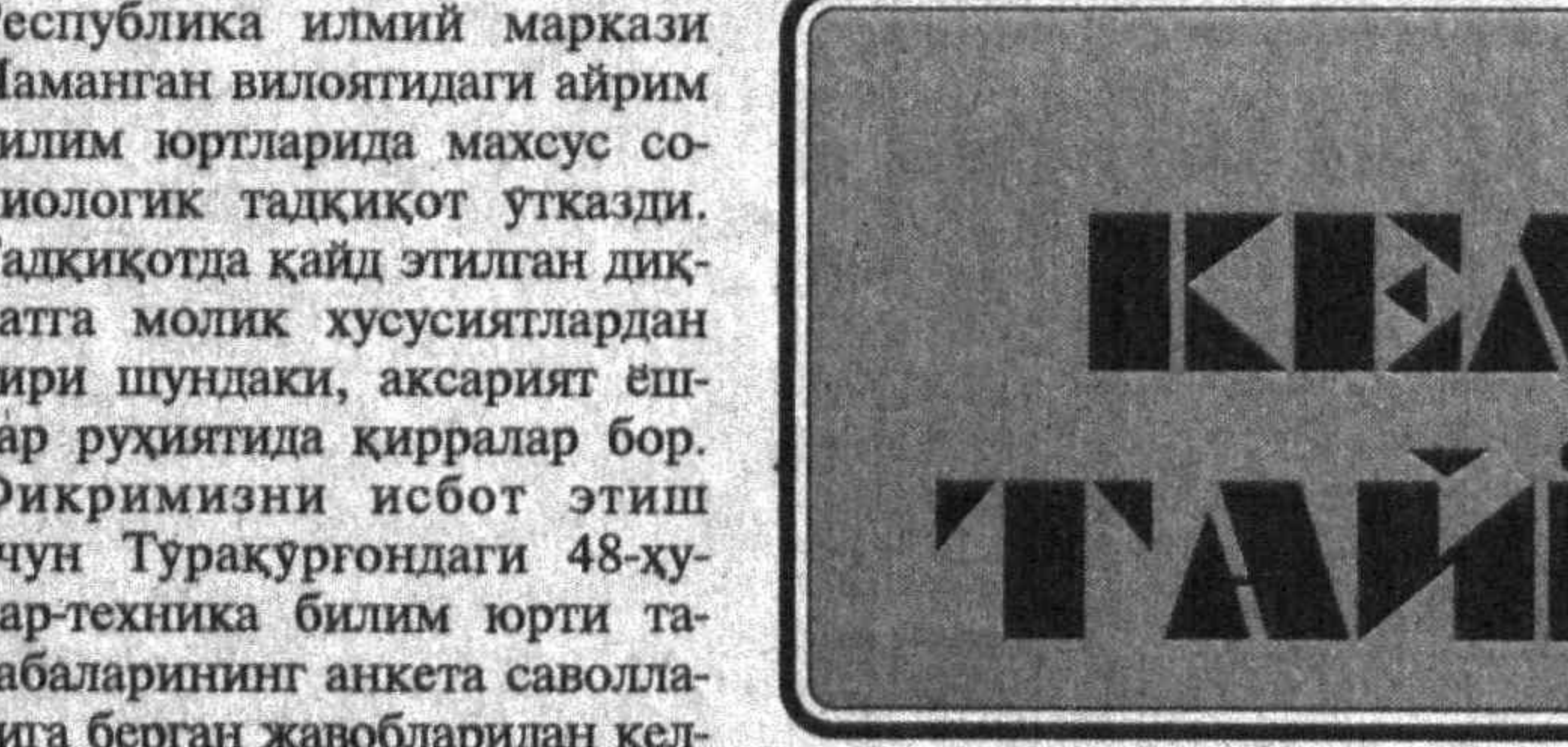
Ешлар ва замон

булган талабни кучайтиришлар Бунга турли янги корхоналар очилиб, борларини тула қувват билан ишлашни таъмин этиш ва хусусийлаштириш жараини тизлаштириш орқалигина эришиш мумкин.