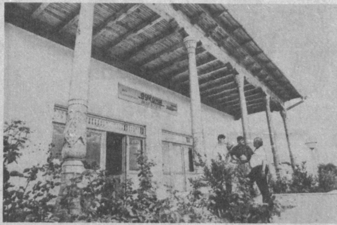
из леса, привозимого из Красноярск, изготавливаются двери, рамы, ящики. Также по договору из Маргилана завозятся ткани, из которых в швейном цехе фирмы шьют обивку для диванов и кроватей, а также покрывала. НА СНИМКАХ: образцы изготавливаемой мебели в торговом-промышленной фирме "Тохирий"; магазин-чайхана при фирме.