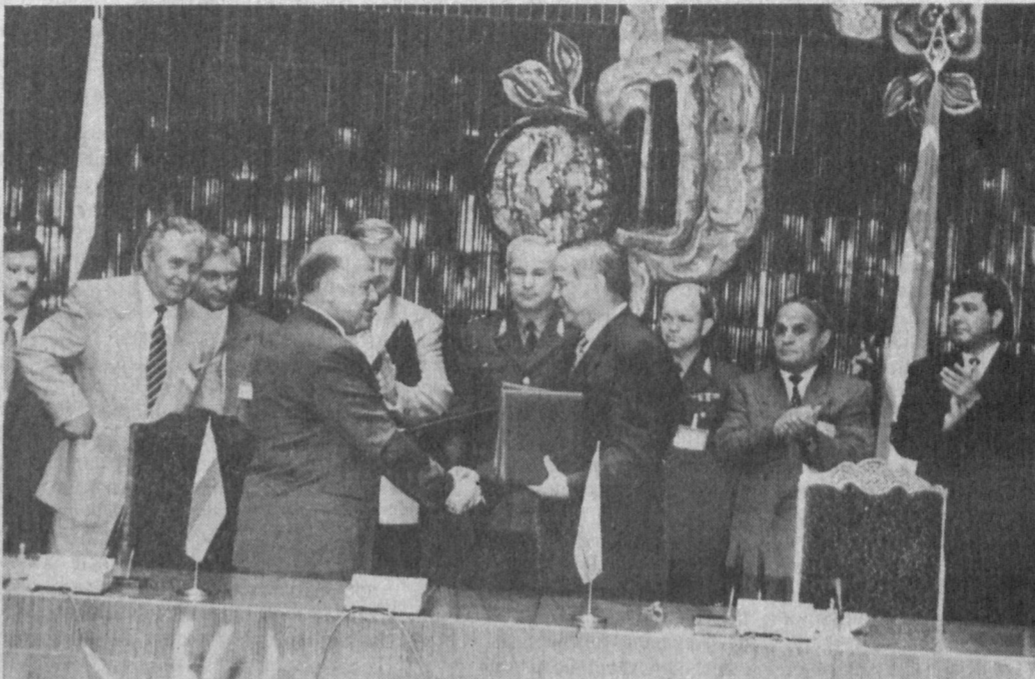
В. Черномырдин и Ислам Каримов во время официального визита в Узбекистан.

Яковлев, Тухтагули, Ибрагимов и еще десять подписей. Янгйуль, Рабочий поселок.