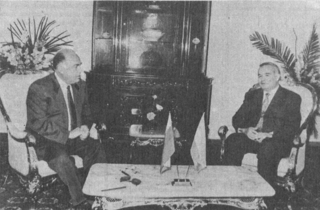
Ислам Каримов и Виктор Черномырдин во время официального визита в Узбекистан.