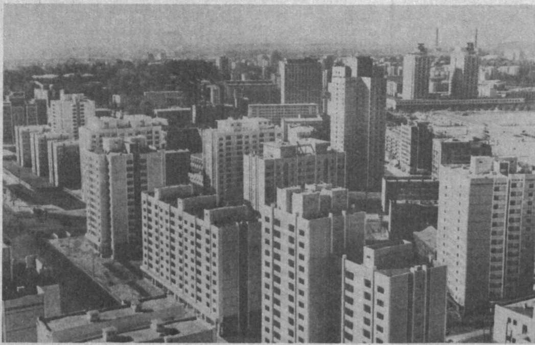
Столица КНДР растет в ширь, и ввысь. НА СНИМКЕ: новостройки одного из районов Пяньяна.

Это сообщение опубликовало министерство внутренних дел Франции, которое ведет расследование инцидента, парализовавшего движение поездов на линии метро, проходившей через центр французской столицы.