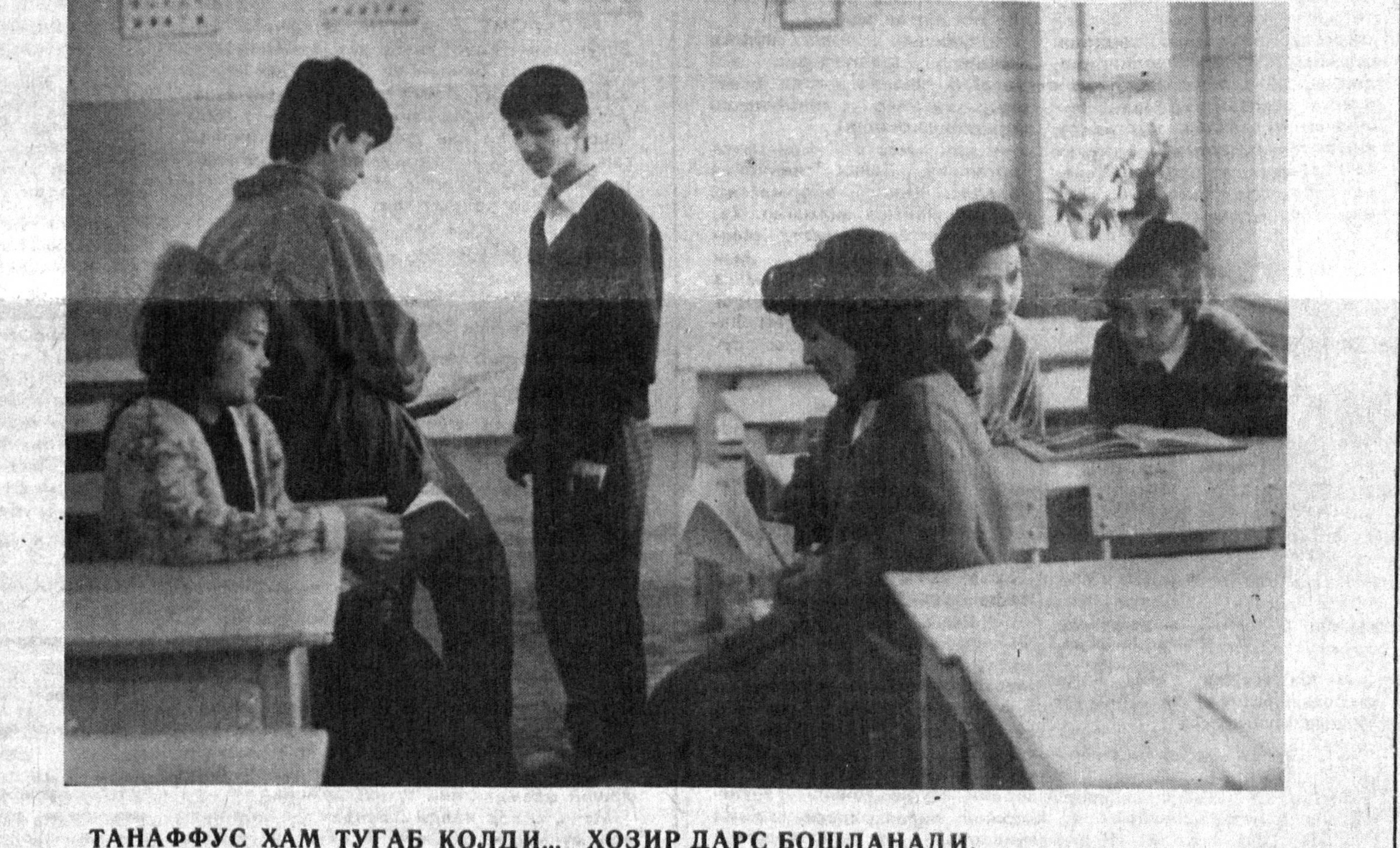
ТАНАФФУС ҲАМ ТУГАБ ҚОЛДИ... ҲОЗИР ДАРС БОШЛанаДИ.

«Шпаргалка», «шпора» деса ҳаммагиз тушунасан албатта. Унинг ёрдамига таъинмаган одам бор дейишса, асло ишонманлар. Бундай одам бўлмаган, бўлмаса ҳам керак. Ҳатто энг жиддий ва қаттиққўл ўқитувчиларингиз ҳам бир вақтлар шпаргалкадан фойдаланишган. Бу сирни сизларга ишониб айтаямиз, бола- ТАЖРИБА АЛМАШАМИЗ... ФАҚАТ БУ ҲАҚДА ЖИМ!