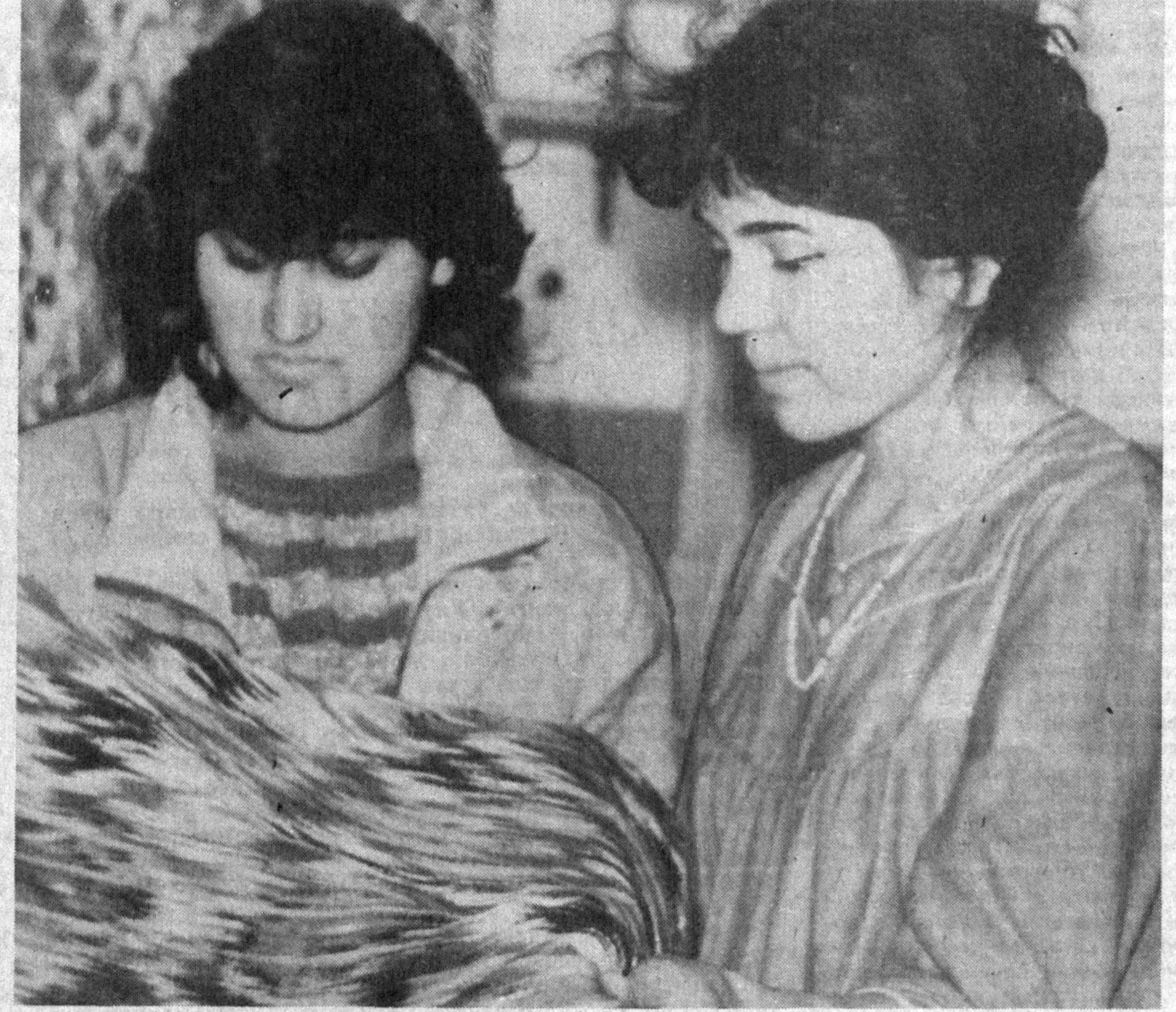
Ҳар бир ташкилот, корхона ўзининг катта-кичиклигига қараб эмас, кўпроқ қилаётган иши, бажарётган юмушини билан ўлчаганлиги. Бу борада Шойфюрер туманидаги «Вароғиз» кичик корхонасининг омади келган. Ахир корхона ишлаб чиқарётган маҳсулотлар харидорларга, қолаверса байрам яқин. Хотин-қизларимизга атласнинг қуйиб қўйгандек

ларга юборилди. Президент бир қанча фармонлар қабул қилди, улар аёллар ва болалар саломаатининг муҳафазасида бундай орден бўлмаган.