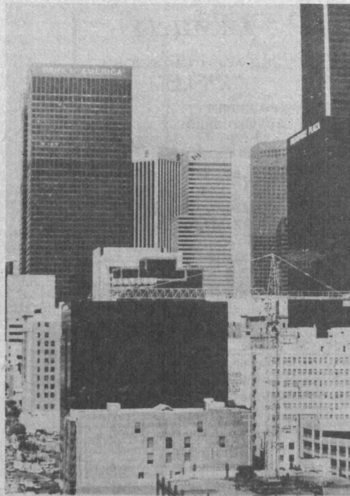
ПО ГОРОДАМ МИРА

Модернизация ВВС как важнейшего компонента вооруженных сил Филиппин выдвинута в качестве первоочередной задачи филиппинского правительства.