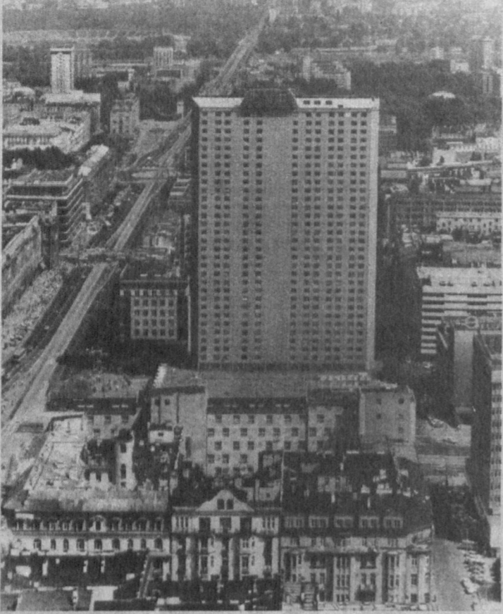
ПО ГОРОДАМ МИРА

Администрация Билла Клинтона поддержала законопроект, предусматривающий продление в США срока действия авторских прав, и выступила за принятие американского закона в соответствии с аналогичными актами Европейского Союза.