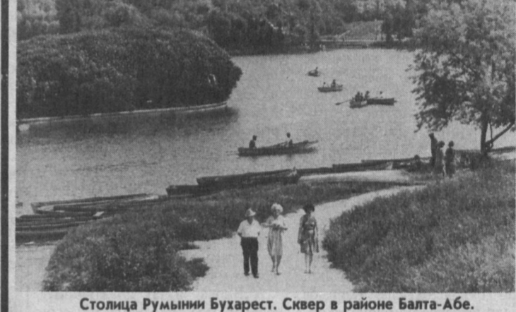
Столица Румынии Бухарест. Сквер в районе Балта-Абе.