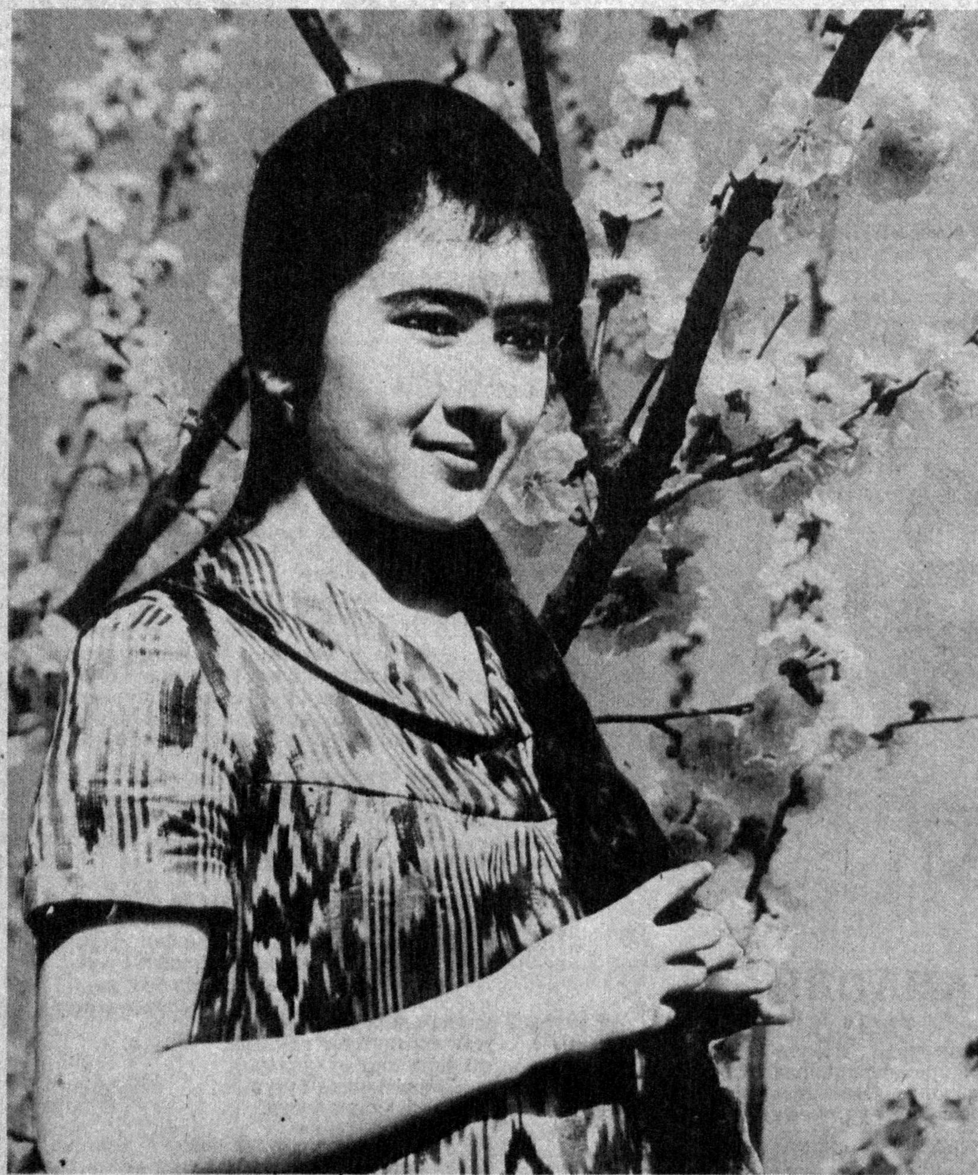
ХАР ТУНИНГ ҚАДР УЛУВОН, ХАР КУНИНГ УЛСУН НАВРЎИ!