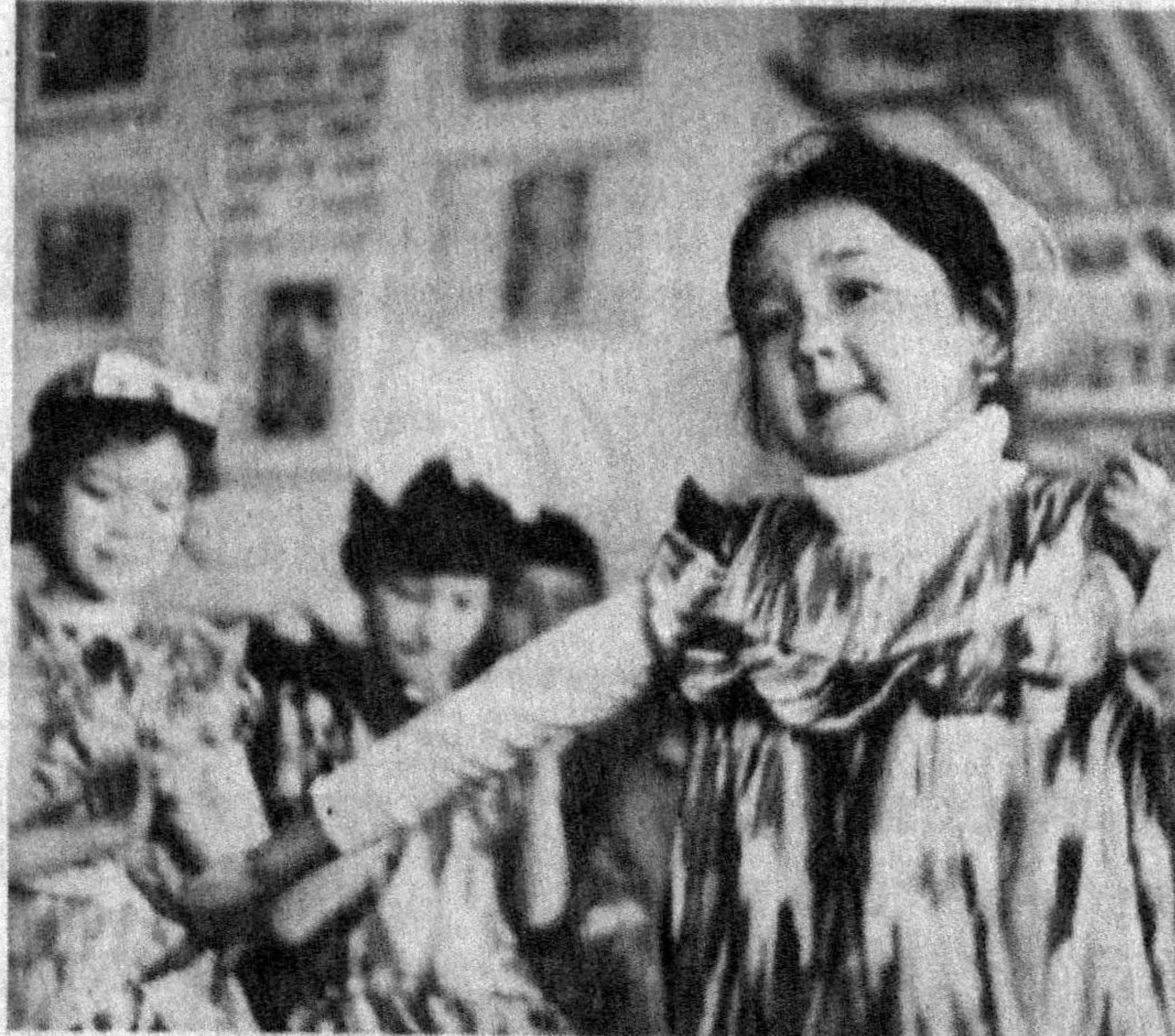
Кўнча чинди намалек, Наврўздан бир нишона, Дошқозонда сумалак, Учоқ бошида она... Сумалак сузинг она... Норбек УСАНОВ.