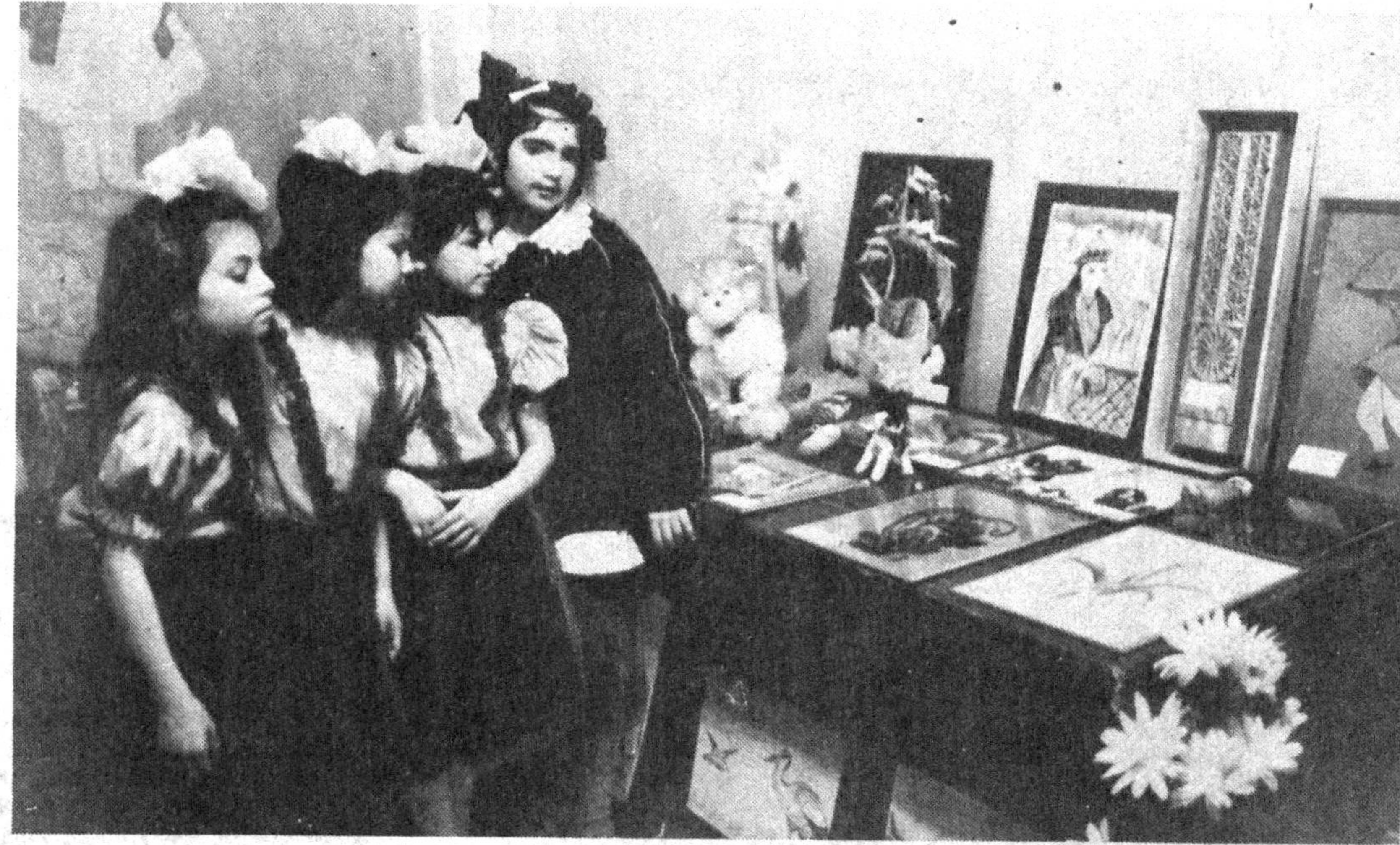
Яқинда Тошкент шаҳрида «Меҳрибонлик» дея ном олган болалар фестивали бўлиб ўтди. Унинг иштирокчилари республикамиздаги турли болалар уйлари, мактаб-интернат таърибланувчилари, ўзбекистон, болалар ва ёшлар уюшмаси, «Муруват» кичик-корхонаси, Фестиваль қўнғили кечини болаларнинг дардига малҳам бўлишига, кўй-қўшиқлар тинглаб ҳордиқ-инқиршиқларига, турли соғвалар олиб, шодланишларига сабаб бўлди.

Анинг шайдоси бир деҳқон, мунга шайдо бари олам. Маҳбубага нисбатан «сарви равон», «сарв» каби историквий нисбатлар қўлланиши фақат бадий санъатининга эмас, балки инсон илоҳий ҳусн зуҳур этуви она табиятининг бир бўлаги, унгача бир нуқсаси қабилидаги фалсафий мушоҳадани ҳам билдиради. Иккинчи сатрдаги қисс ҳам қизик: сарв ёки умуман, дархат ва боғнинг асосий парвароши этувчиси демак, бирдан бир шайдоси — Боғбон. Мазъуқи манзурнинг шайдоси эса бутун олам. Бу муболағга ўхшаб кўринади. Лекин муболағга кўламлидан билиниб турибдики, таъриф-таъсиф ҳаётини инсон ҳақида эмас, муқаррар суратда бутун борлиқни ўз ҳусни билан мафтун ва мунаввар этиб, меҳру муҳаббат ришталари ила маҳкам тортиб турувчи Тангри тельати тўғриси-