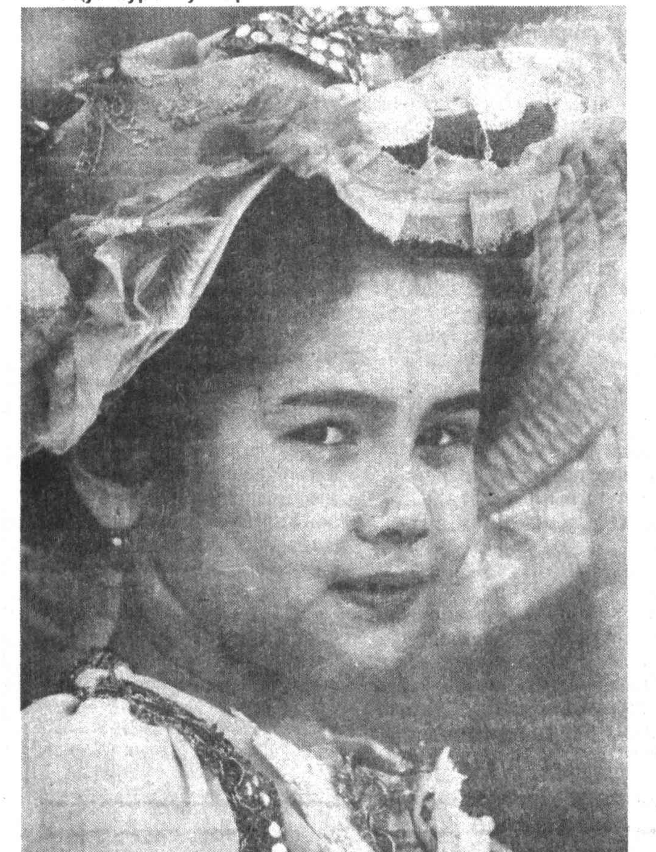
«Мен телевизор кўришни сўқираман. Аммо...»

8.00 - 8.25 «Ахборот». 8.25 Республика газеталарининг шарҳи... 17.10 Янгиликлар. 17.15 «Эркатой».