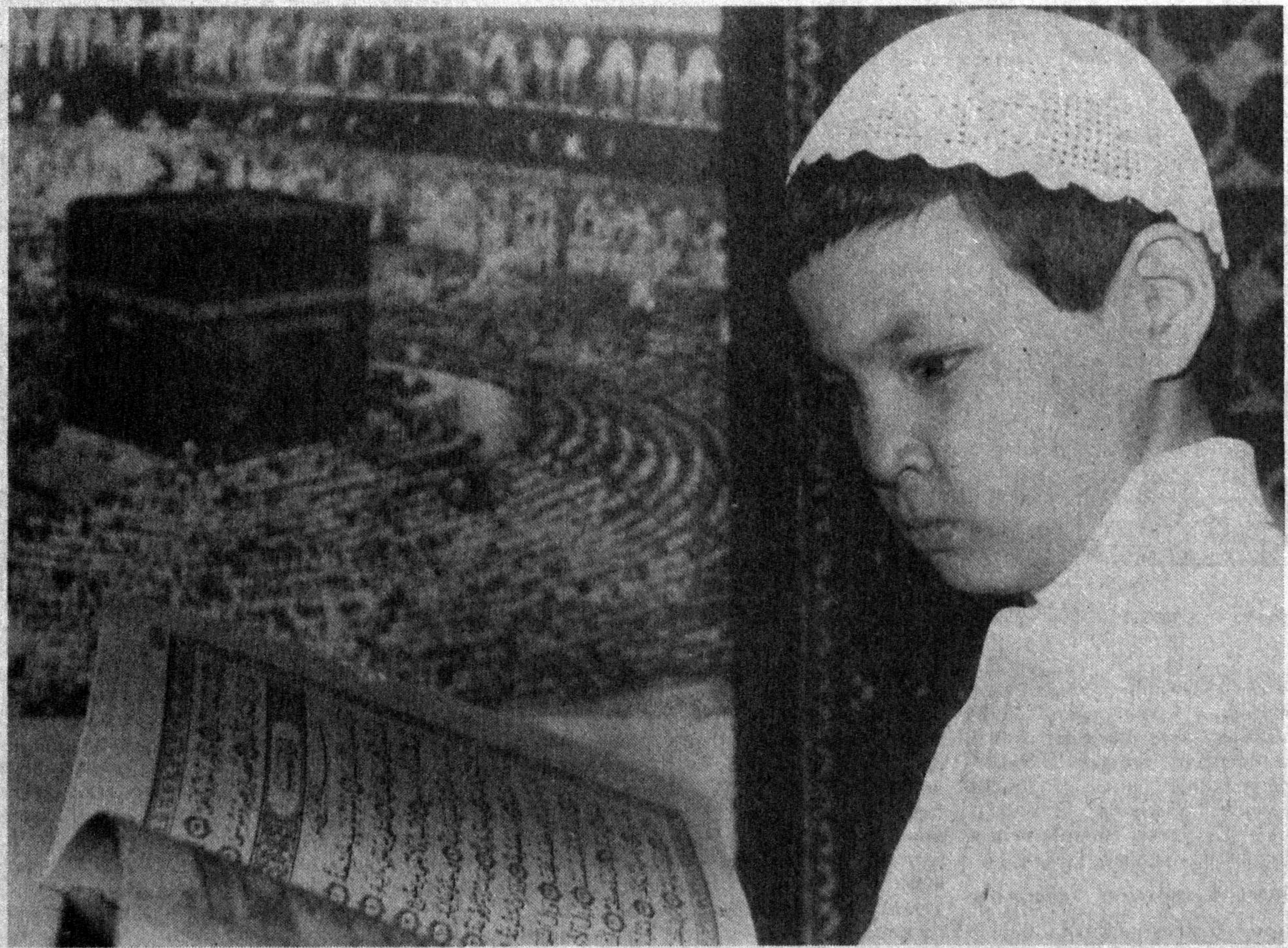
Видеон эркинлиги — олий қадрлигимиз