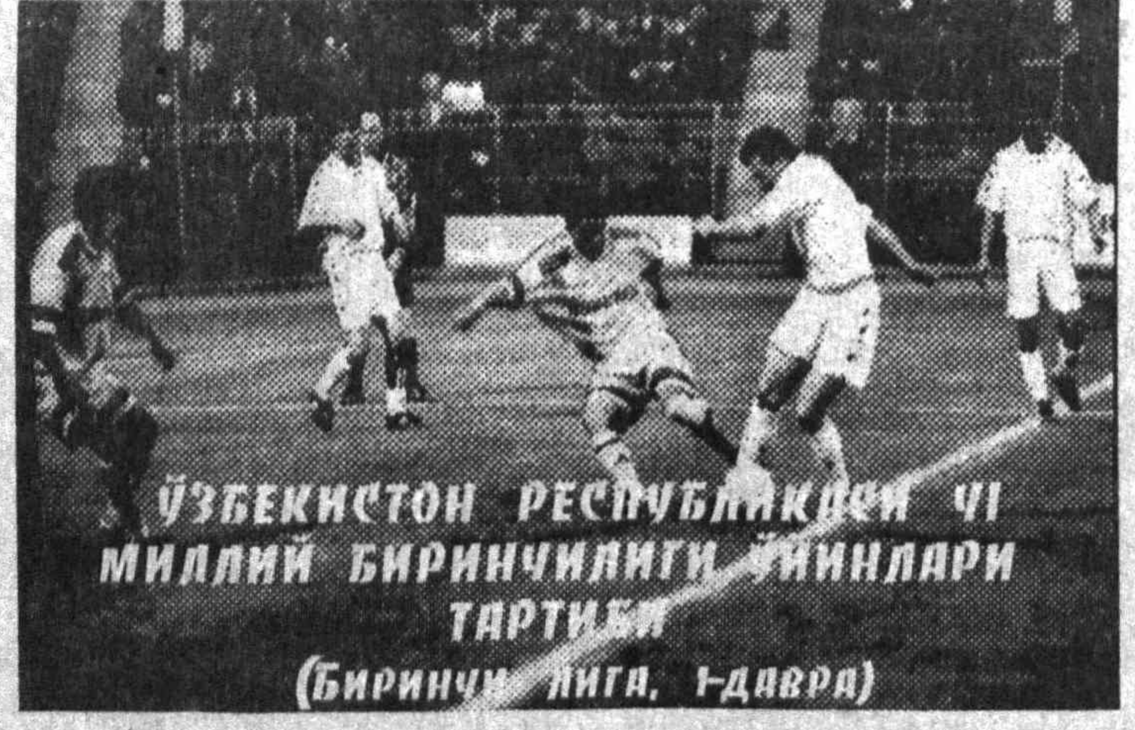
ЎЗБЕКИСТОН РЕСПУБЛИКАСИ ЧИ МИЛЛИЙ БИРИНЧИЛИГИ УНИВЕРСАДА ТАРТИБИ (БИРИНЧИ ЛИГА, 1-ДАВРА)