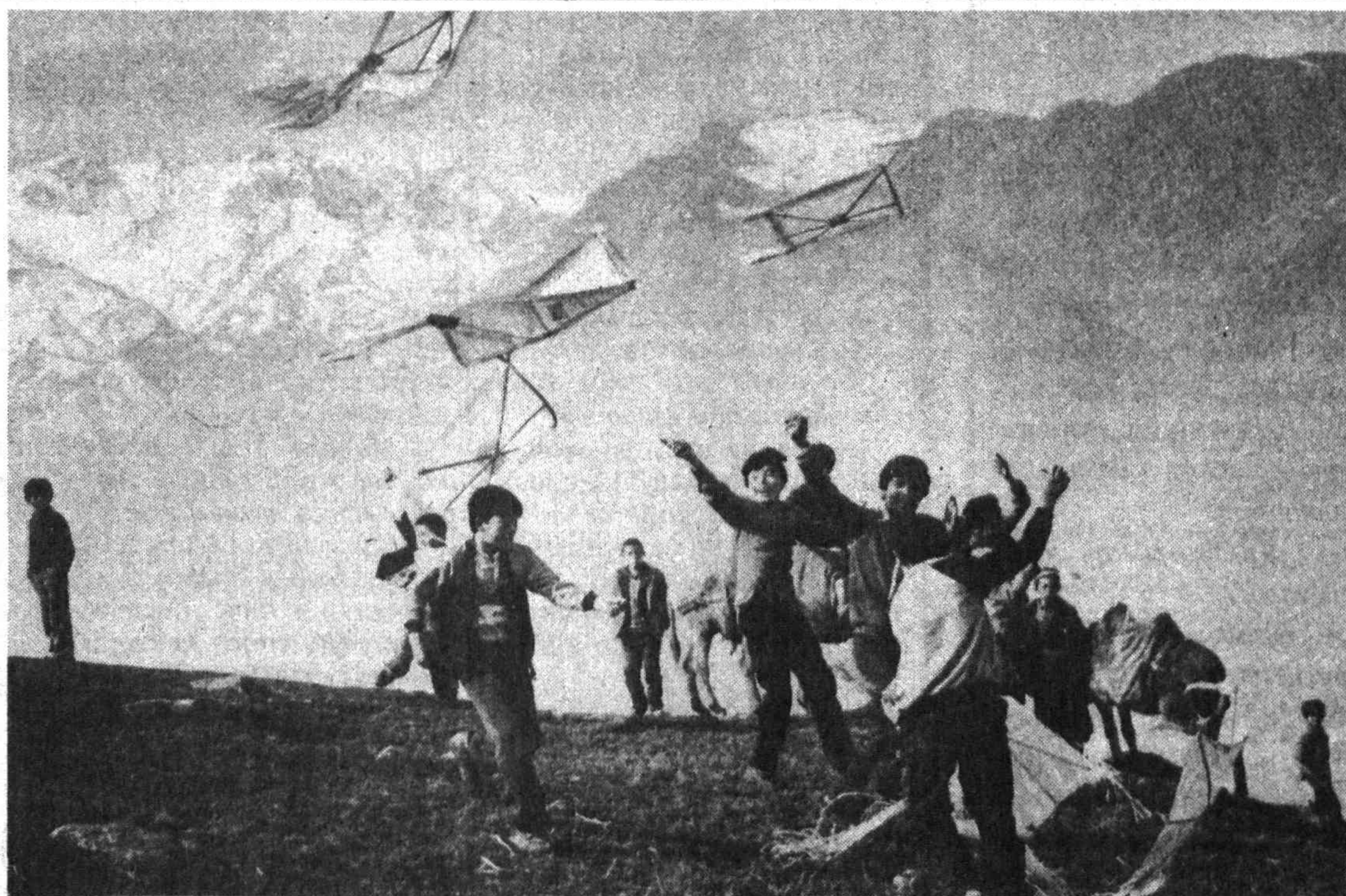
Орзулардек узоқларга уч баррагим!