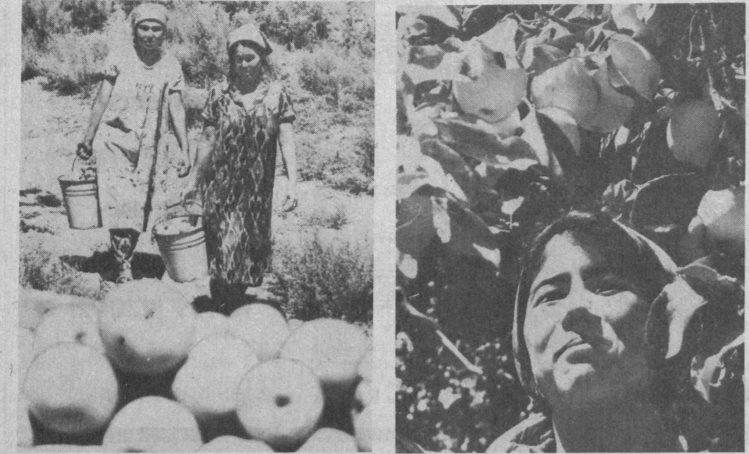
Узбекистан и мир