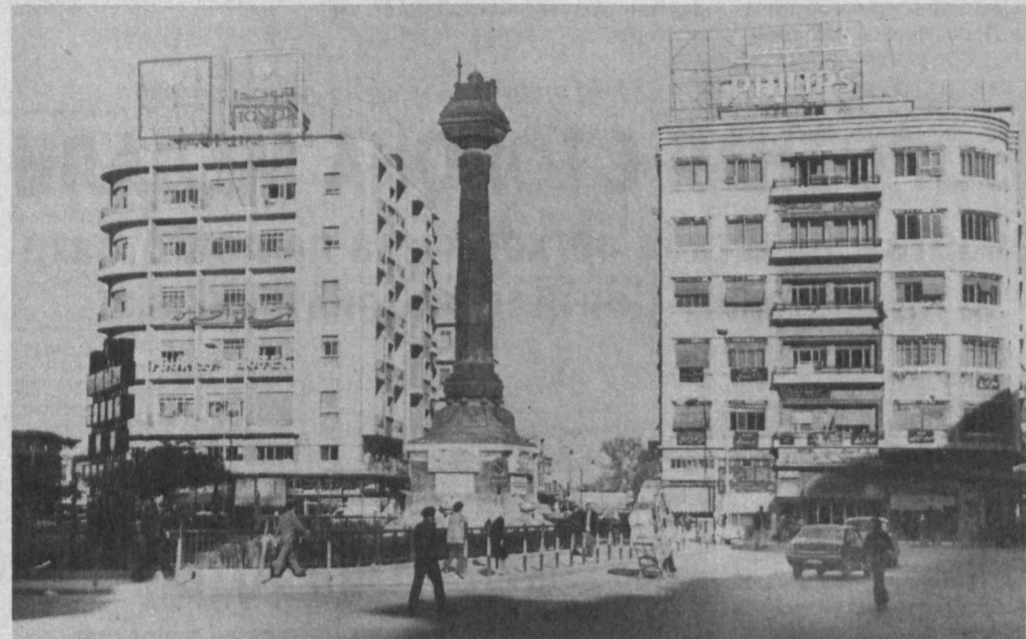
ПО ГОРОДАМ МИРА В центре Дамаска, столицы Сирийской Арабской Республики.

Среди других возможных сфер гражданского применения разведанных из космоса Дж. Бейкер назвал ранее предупреждение о надвигающихся стихийных бедствиях, изучение природы землет-