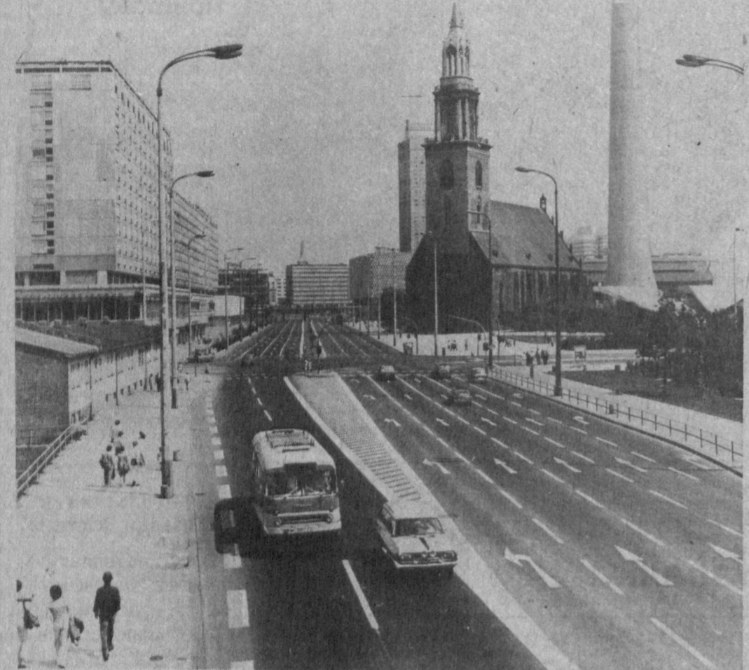
ПО ГОРОДАМ МИРА

Правительство вряд ли удастся ограничить размеры инфляции в рамках 15 проц., о чем, как о важной программной задаче на этот год, было заявлено премьером Ли Пэнгом на последней сессии ВСНП.