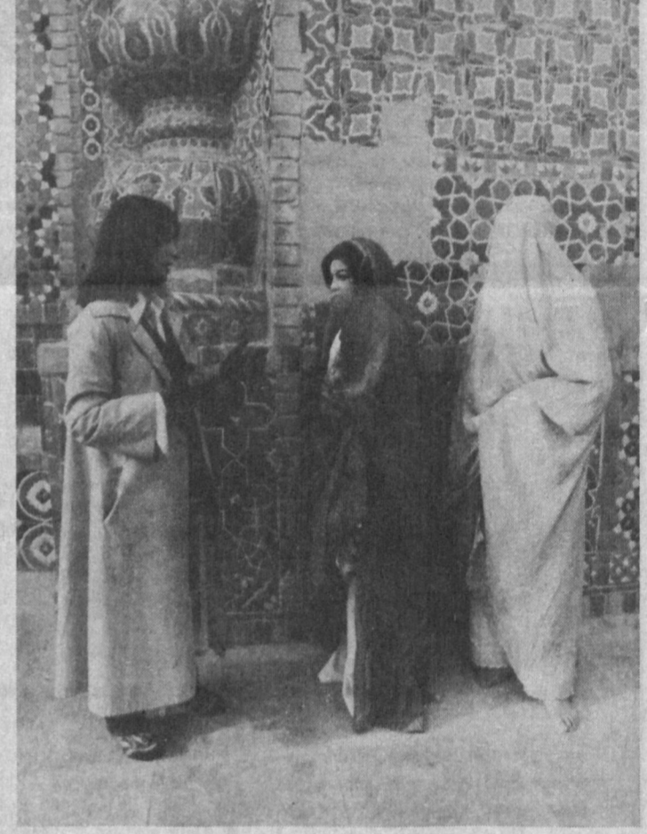
Сошлись эпохи...

И вот спустя несколько десятков лет церковь расплапала двери. Это событие - еще одно зримое подтверждение интернациональной политики нынешнего руководства республики во главе с Президентом Исламом Каримовым.