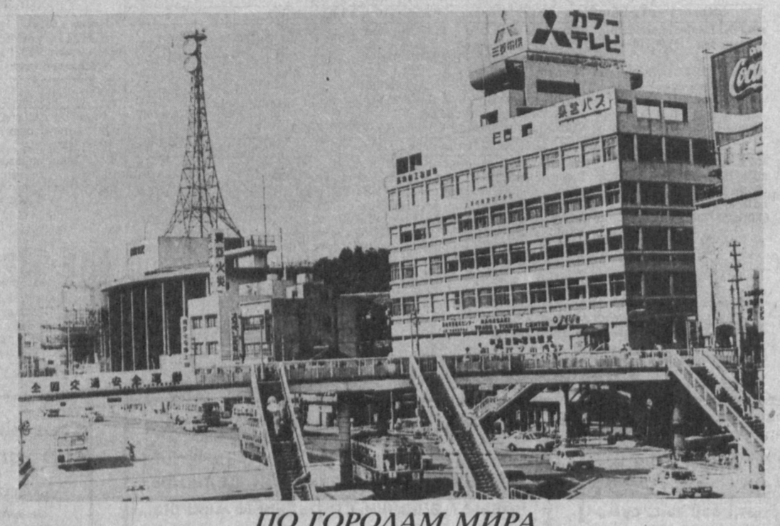
ПО ГОРОДАМ МИРА Нагасаки - важный промышленный и культурный центр Японии. На одной из улиц в центре города.

Это и дало повод трактовать меры, предложенные в нем, как что-то такое, что следует скрывать от квебекцев, да и от общественности всей Канады. Вслед за пресс-конференцией лидера сепаратистов с журналистами в федеральном правительстве Люсьен Робийяр, на которую возложена разработка стратегии Оттавы по подготовке к квебекскому референдуму. Министр утверждала, что злополучный документ носит сугубо предварительный, рабочий характер и что ни она, ни премьер-министр Жан Кретьен с ним не знакомы. О документе вообще могли знать всего несколько человек, и то, что он неизвестно как попал в руки сепаратистов, - серьезный "прокол" для правительства, в кругах которого, вероятно, есть политически нечистоплотные лица, отмечают обозреватели.