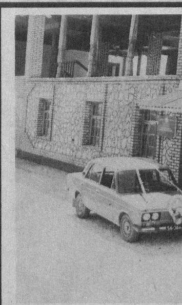
В канун праздника - 4-й годовщины Дня независимости республики - в городке "Усам" Бахмальского района сдан в эксплуатацию Дом счастья. Это здание, выполненное в восточном стиле, строилось методом хафара. Здесь будут проводиться свадебные торжества и вечера.

Областным органом и проведен совместно с Центробанком области семинар-совещание, где были рассмотрены проблемы банковского обслуживания предпринимателей.