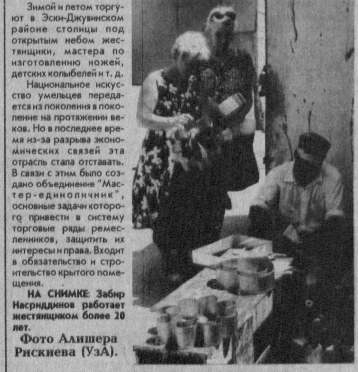
Зимой и летом торгуют в Эсон-Джувинском районе столицы под открытым небом жестианчики, мастера по изготовлению ножей, детских колыбелей и т. д. Национальное искусство умельцев передается из поколения в поколение на протяжении веков. Но в последнее время из-за разрыва экономических связей эта отрасль стала отставать. В связи с этим было создано объединение "Мастер-единоличник", основные задачи которого - привести в систему торговые ряды ремесленников, защитить их интересы и права. Входит в обязательство и строительство крытого помещения.

Станислав Алтуянец, Обозреватель "Правды Востока".