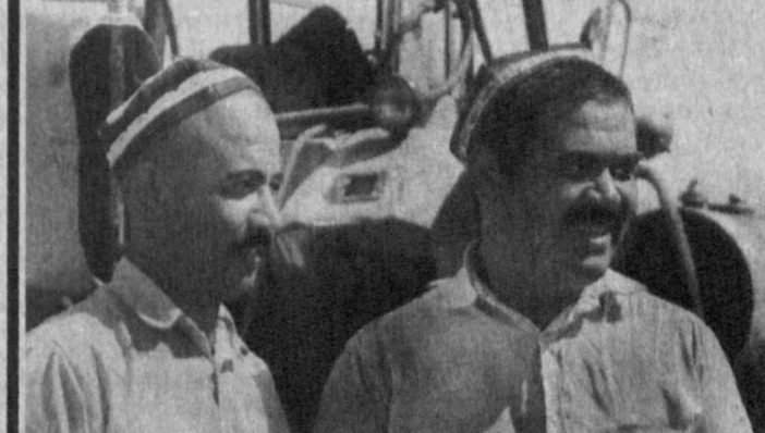
СТРАДА: ДЕНЬ ЗА ДНЕМ