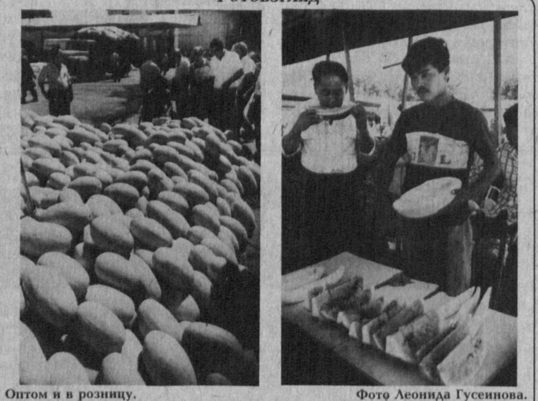
Оптом и в розницу.

Главный редактор Р. А. Сафаров Редакционная коллегия: И. Абдукаримов, В. Дегтярев (отв. секретарь), С. Зинин, Л. Кабилов, Д. Камалов, П. Ким, С. Мансуров-Ковригенов, Ф. Мунинов, О. Филимонов (зам. главного редактора), М. Хазраткулов, Ю. Хамидов, Б. Хасанов (зам. главного редактора), Р. Шагулямов.