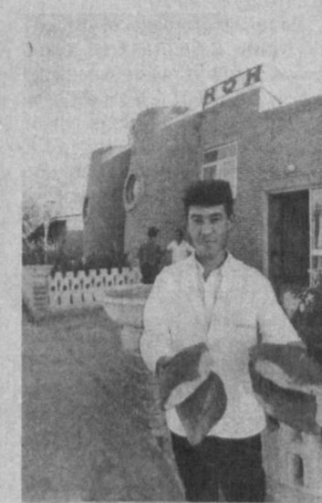
детская инфекционная больница, школы, много других объектов торговли и социально-культурного назначения.