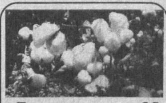
Белое золото - 95