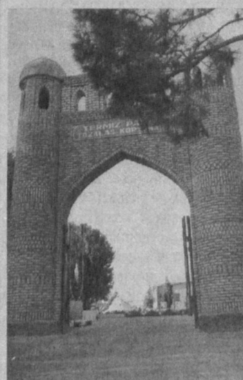
Растет и с каждым днем становится все краше центр самой южной области республики - Сурхандария - вечно молодой и древней Термез.