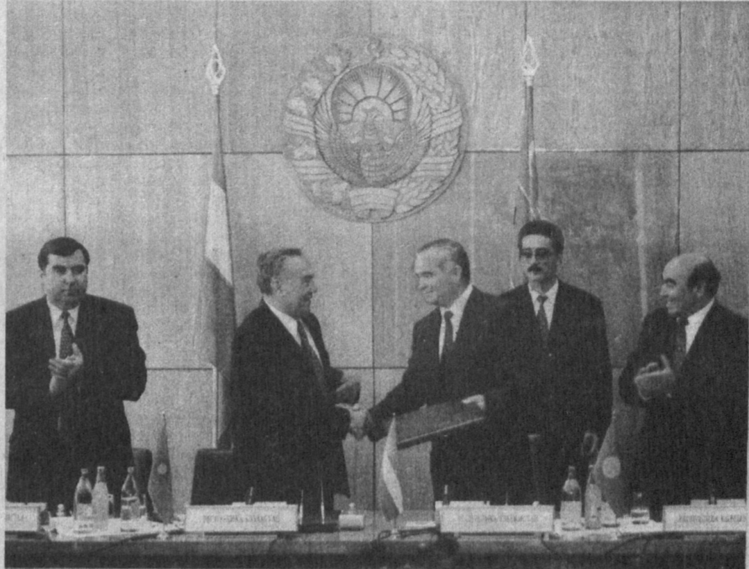
НА СНИМКЕ: во время подписания декларации.