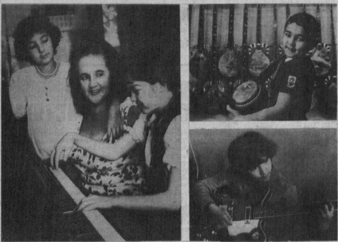
Образование: грани реформы