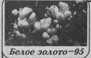
Белое золото - 95

Мастерам кожаной перчатки нашей страны ждет ответственный экзамен. С 30 сентября по 8 октября в столице нашей республики будет проходить чемпионат Азии по боксу. В этих состязаниях, которые состоятся во дворце спорта "Алпамыш", примут участие мастера кожаной перчатки из Китая, Японии, Таиланда, Южной Кореи, Филиппин и ряда других стран. Впросам подготовки этого большого спортивного мероприятия 25 сентября было посвящено заседание организационного комитета. Его вел первый заместитель премьер-министра Республики Узбекистан, председатель организационного комитета И. Джурбеков. На заседании была заслушана информация заместителя премьер-министра республики, президента Федерации бокса Узбекистана У. Исмаилова, председателя Госкомитета по физкультуре и спорту С. Рузиева о ходе подготовки к проведению чемпионата Азии по боксу. С отчетами о работе по подготовке к предстоящему чемпионату выступили также руководители соответствующих ведомств. В заседании организационного комитета принял участие заместитель премьер-министра республики С. Саидкасымов. (УзА).