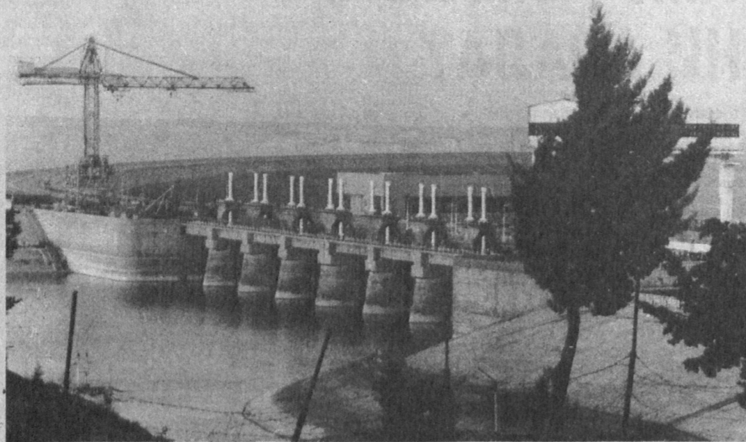
Евфратская ГЭС - важный объект, обеспечивающий электроэнергией Сирию, и вдобавок - важное гидротехническое сооружение, регулирующее сток вод реки Евфрат.

В результате отход от мировоззрения основателя Израиля Давида Бен-Гуриона, который считал армию инструментом государственного строительства, предназначенным для того, чтобы трансформировать иммигрантский сброд из столь раз-