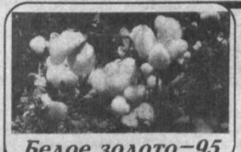
Белое золото - 95

Продолжает развиваться успешное сотрудничество между Джизакской областью и Джамбулской областью Казахстана. В этом году Джизакцы отправили на Джамбулский городской сахарный комбинат 20 тысяч тонн сахарной свеклы. А готовая продукция с комбината была отправлена целлинником.