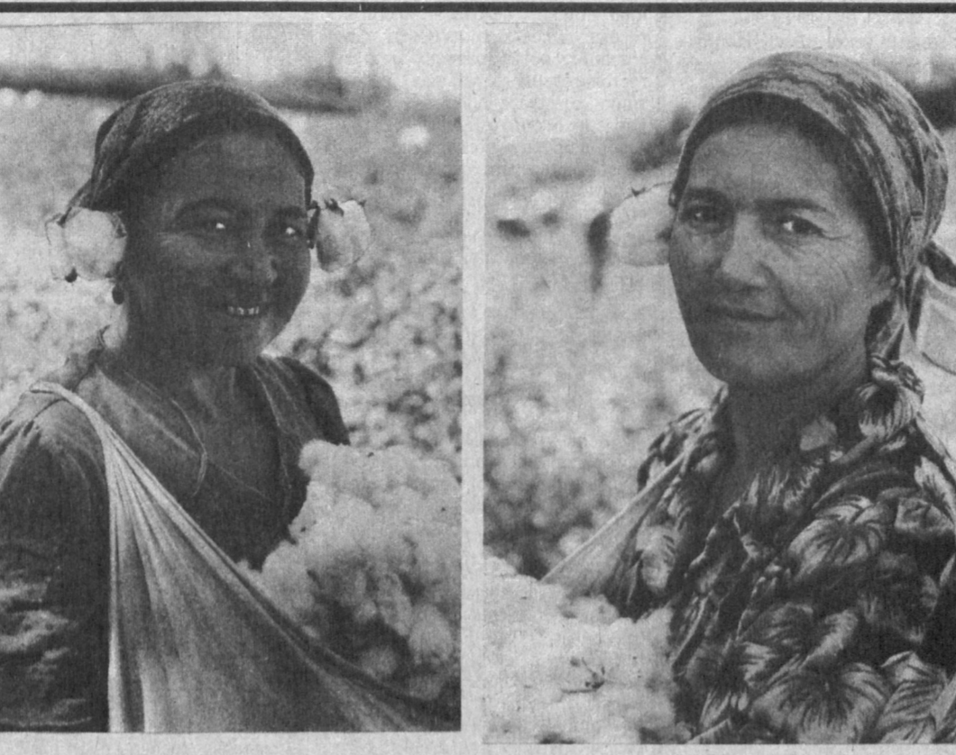
Вести из Сурхандарьи