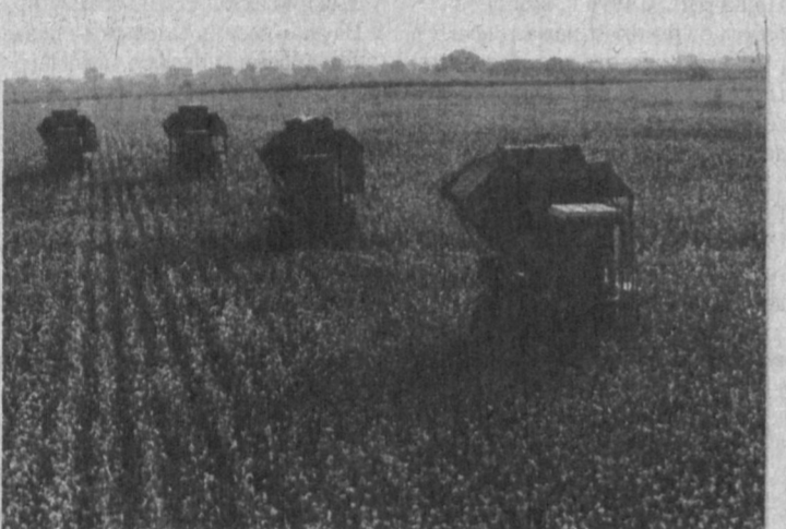
СТРАДА: ДЕНЬ ЗА ДНЕМ