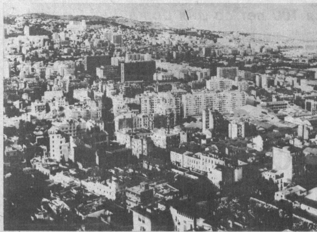
По городам мира Крутыми живописными уступами сбегают древние улочки и современные магистрали столицы Алжира к Средиземному морю.

Помимо этой весьма впечатляющей сцены, бывший пресс-секретарь рассказывает о том, как уходил буквально в слезах со своих постов три руководителя аппарата сотрудников Белого дома, повесть о том, что стало истинной причиной их отставки, описывает организаторов президентской предвыборной кампании, настояло поглощенных собственными интересами, что они вынуждены были пригласить к себе на помощь государственного секретаря США только для того, чтобы он стал посредником в распределении должностей между ними, и рассказывает о многих других интересных эпизодах президентства Рейгана и Буша. Так что любителям политической кухни новая книга даст немало пищи для размышлений - остается только дождаться ее выхода в свет.