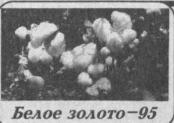
Белое золото - 95