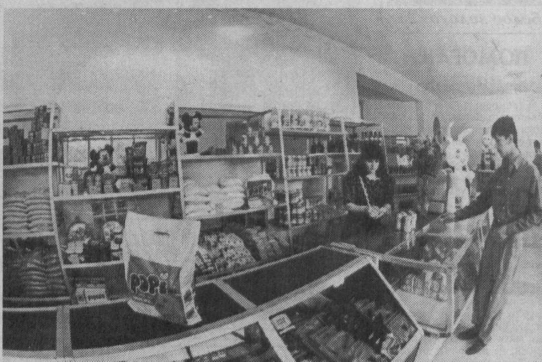
В последнее время в Навои активизировалась работа по обслуживанию населения - строятся рынки, открываются новые магазины, салоны - парикмахерские и по оказанию других бытовых услуг. НА СНИМКЕ: магазин фирмы "Азиз" в ятм микрорайоне города.

публикации сборника - выступления руководителей национальных культурных центров, рассказывающих об опыте их работы по возрождению самобытных традиций и обычаях всех наций и народностей, живущих в Узбекистане. Ведь проблемы культуры межнационального общения могут решаться на практике только на основе сочетания национальных и общечеловеческих интересов и ценностей. "Культура межнационального