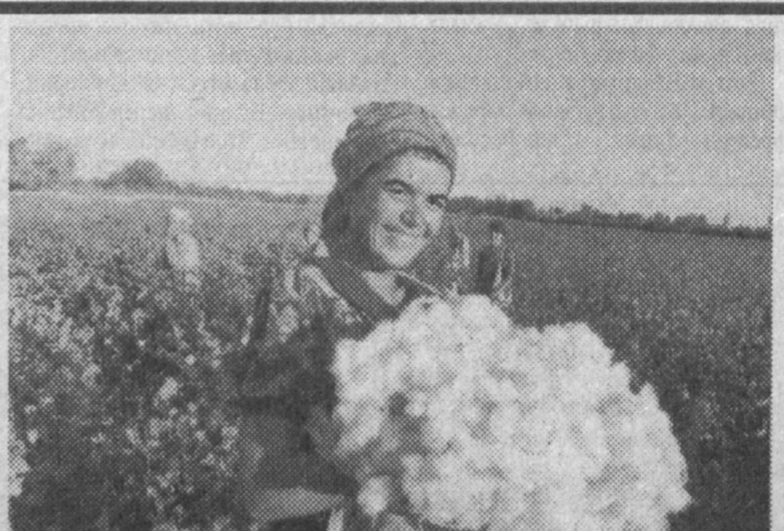
Близится к завершению уборка хлопчатника в колхозе "Дослик" Элликалинского района Каракалпакстана. Несмотря на нынешнее маловолье, экономические, экологические трудности, труженики вырастили неплохой урожай. В бригадах планируют получить

Юрий Гентшке. Соб. корр. "Правды Востока".