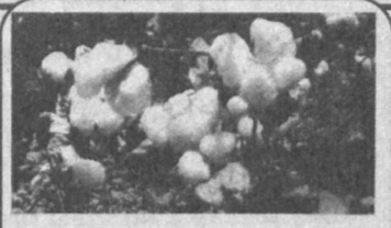
Белое золото - 95

Даже в сложных условиях нынешнего года хлопководы Ферганской области вырастили на редкость богатый урожай. Самым в оптимальные сроки убрать его до непогоды земледельцы некоторых хозяйств не под силу. И потому они обратились за помощью к горожанам.