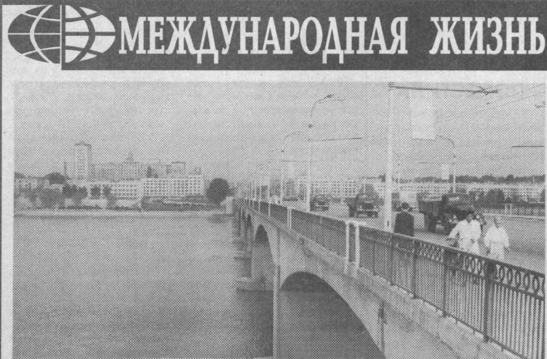
Пхеньян. Вид на центр города с правого берега реки Тэдонган.