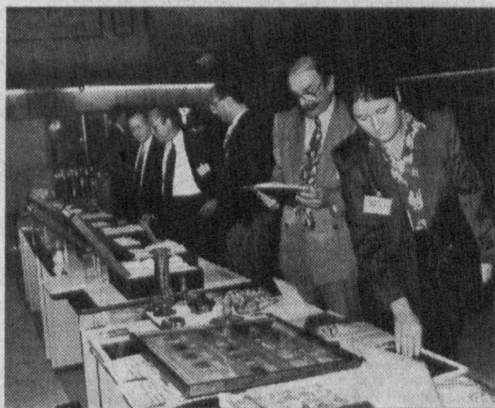
НА СНИМКЕ: во время работы конференции.

Правительство Узбекистана контролирует ход экономических реформ. Оно четко осознает, что никакие реформы невозможно реализовать без активной поддержки народа и государства. Один из основных факторов эффективности