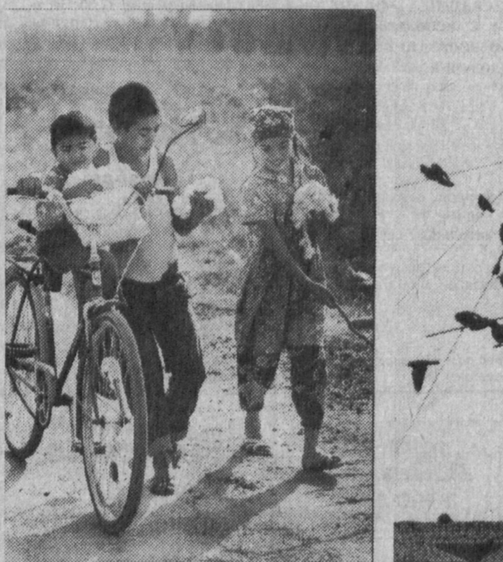
Тепло осени. Штрихи.